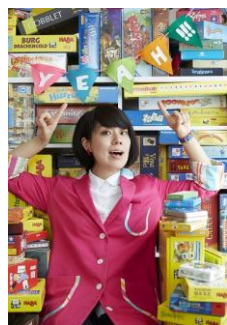
あだちのYEAH!!!プレゼンツ 「アナログゲームパーティー」