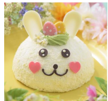
2F フォレットティ・ジェルツタ アイスクーキ「イースターパニーのエッグハンター」 (税込2,980円)