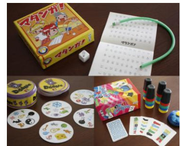
※行うゲームのイメージです