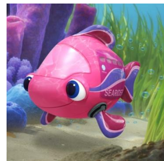
潜水艇「シーライダー」のイメージ