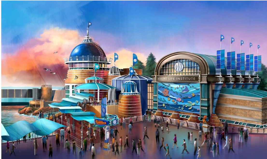
「ニモ&フレンズ・シーライダー」の外観イメージ