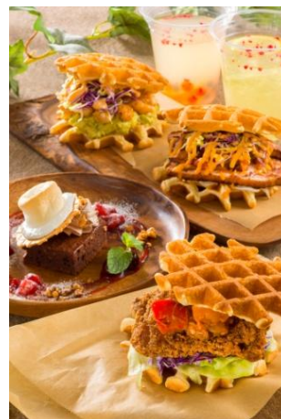
メニューイメージ