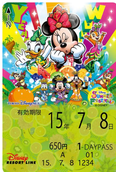
東京ディズニーシー 「ディズニー・サマーフェスティバル」