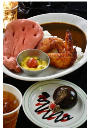
ジャファーをイメージした スペシャルセット 1,580 円 (カスバ・フードコート)