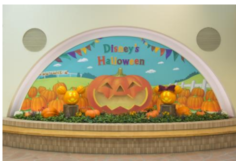
リゾートゲートウェイ・ステーションのデコレーション

また、リゾートゲートウェイ・ステーションでは、ハロウィーンのコレクションが登場し、ゲストのみなさまをお迎えします。