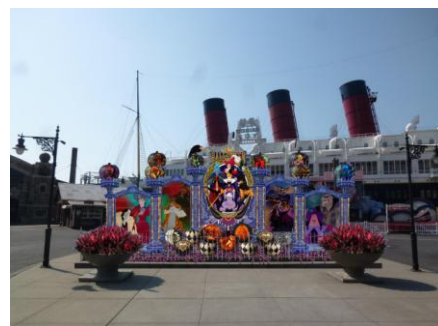
アメリカンウォーターフロント/ニューヨークエリア のデコレーション ※写真はイメージです

東京ディズニーランド では、ディズニーの仲間たちとおぼけたちが、大きなかかし操り人形の下で一緒になって演奏やダンスを楽しんだり、フェアで振る舞われた風変わりなお菓子を食べたりするなど、思い思いの“ハロウィーン・フェア”を楽しんでいる様子を表現したフォトロケーションが、プラザやエントランスに登場します。そのほか、ウエスタンランドやファンタジーランド、トゥーンタウンには、昨年に引き続きパンプキンを中心とした明るく楽しいデコレーションが施されます。