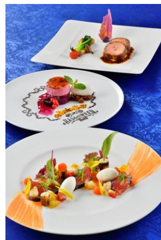
東京ディズニーシー・ホテルミラコスタ 「オチェアノ」 ランチコース