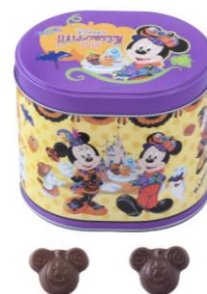
パフチョコレート 750 円 (東京ディズニーランド)

東京ディズニーランド・東京ディズニーシー 共通デザインのグッズでは、かぼちゃの形をしたミッキーマウスやミニーマウスがデザインされたグッズや、ヴァンパイアに仮装したミッキーマウスや魔女に仮装したミニーマウスのデザインのグッズなど、約 115 種類販売します。