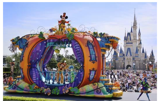
東京ディズニーランド 「ハッピーハロウィーンハーベスト」 ※写真はイメージです