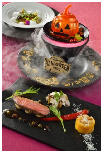
ディズニーアンバサダーホテル 「エンパイア・グリル」 エンパイアディナー