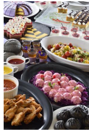
ヴィランズをイメージした スペシャルブッフェ 3,090 円 (セイリングデイ・ブッフェ)