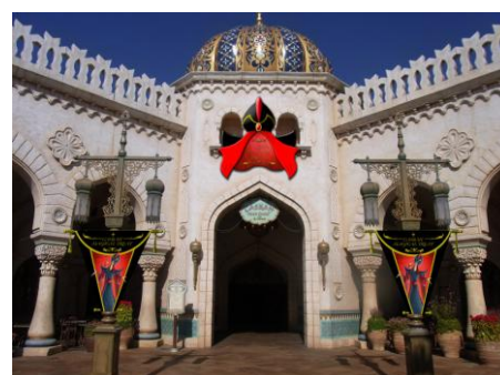
「カスバ・フードコート」 ※写真はイメージです

また、「マジックランプシアター」で登場するシャバーンとアシム、妖しげな黒魔術師、アラビア最強のマジシャンたちが、宮廷の中庭で華やかなマジックを披露したり、レストラン内でマ