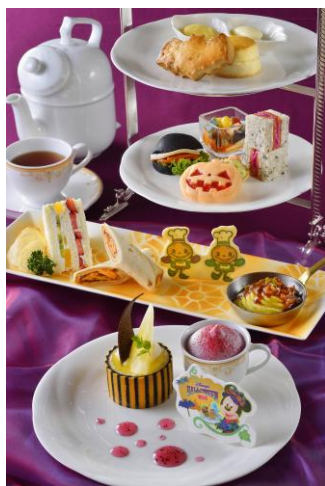
東京ディズニーランドホテル 「ドリーマーズ・ラウンジ」 アフタヌーンティーセット