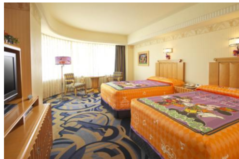
ディズニーアンバサダーホテル 「ディズニー・ハロウィーン」デコレーションの客室 ※写真はイメージです

ディズニーアンバサダーホテルと東京ディズニーランドホテルは、東京ディズニーランドの“ハロウィーン・フェア”をイメージしたお料理を秋の味覚とともに楽しみいただけます。また、東京ディズニーシー・ホテルミラコスタ®では、東京ディズニーシーの“ヴィランズ一色の、クールで妖しいハロウィーン”をイメージしたお料理をご用意します。