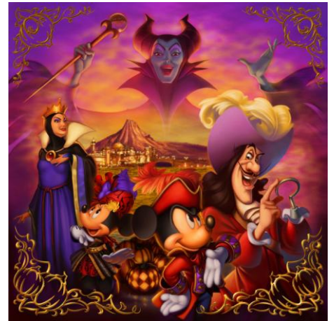
東京ディズニーシー 「ディズニー・ハロウィーン」 ※写真はイメージです

一方、東京ディズニーランドでは、ディズニーの仲間たちと陽気なおばけたちによる“ハロウィーン・フェア”をテーマに開催。パレードルートでは、仮装したディズニーの仲間たちとパンプキンたちが登場する、明るく楽しい手作り感あふれる「ハッピーハロウィーンハーベスト」を、今年も公演します。今年は「風変わりなお菓子」が新たにモチーフに加わり、お菓子の装飾が施され、音楽も一新します。さらに、