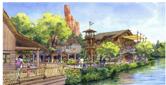
レストラン施設（外観イメージ）