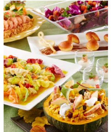
「シャークウッドガーデン・レストラン」 ブッフェ (イメージ)

「ドリーマーズ・ラウンジ」(ロビーラウンジ)では、デイジーダックの“スイーツショップ”をテーマにしたアフタヌーンティーセットや、チップ&デールをモチーフに洋梨や柿などのスイーツを盛り合わせたデザートメドレーをお楽しみいただけます。