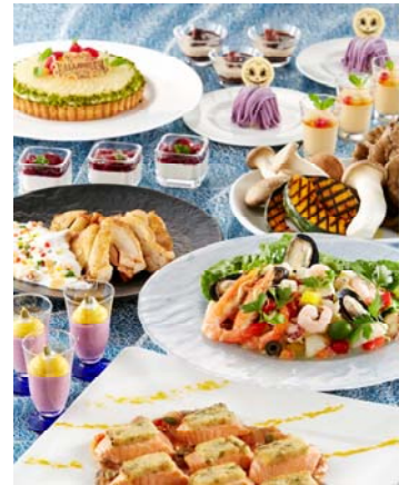
「オチェアーノ」 ブッフェ (イメージ)