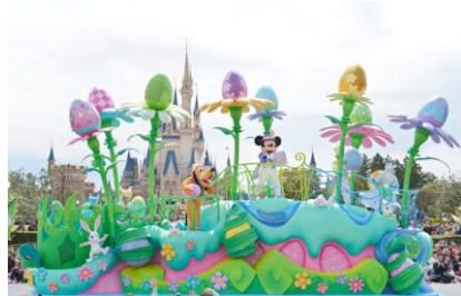
東京ディズニーランド 「ヒッピーティ・ホッピーティ・スプリングタイム」

また、エントランスやメディテレーニアンハーバーでは、ヨーロッパで見られるエレガントで華やかなデザインのイースターエッグ、アメリカンウォーターフロントのニューヨークエリアでは、アーティストックなイースターエッグ、ケープコッドエリアでは田舎の港町で開催される手作り感あふれるデコレーションを飾りつけ、東京ディズニーシーならではの「ディズニー・イースター」