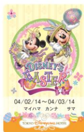
東京ディズニーランドホテル ルームキー