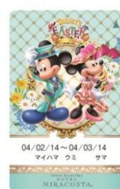
東京ディズニーシー・ホテルミラコスタ ルームキー