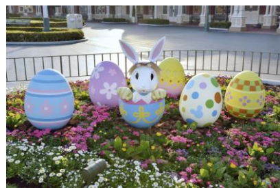
東京ディズニーランド デコレーション