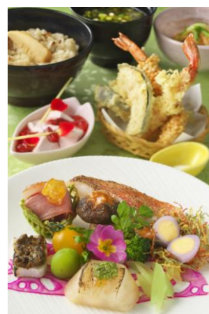
レストラン スペシャルメニュー

「リバティ・ランディング・ダイナー」のカラフルなサンデーや、「バーナクル・ビルズ」の真っ赤なビアカクテルといった見た目もおしゃれなメニューや、「ケープコッド・クックオフ」のダッフィーモチーフのチョコレートがトッピングされた可愛いスーベニア付きメニューなども登場します。