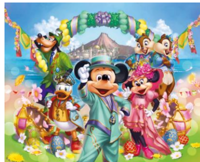
東京ディズニーシー 「ディズニー・イースター」