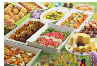
クリスタルパレス・レストラン スペシャルbuffet

また、「グランマ・サラのキッチン」では、タマゴが割れてそこから料理が飛び出したかのようなイメージで盛り付けられたスペシャルセットや、この時期限定でミックスベリーフレーバーに変わる「ラケットィーのラクーンサルーン」のクリッターサンデーを販売します。このほか、ミッキーマウスが描かれたマカロンなど、おもしろ楽しいイースターならではのメニューを販売いたします。