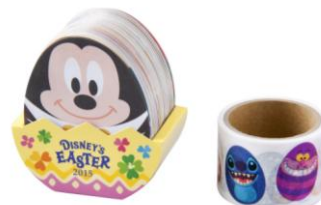
メモ&マスキングテープ

また、東京ディズニーリゾート共通デザインのグッズでは、“タマゴがいっぱい”をテーマに、様々なディズニーキャラクターやシンデレラ城などのパークシーンがイースターエッグデザインになって登場します。33種類のイースターエッグをデザインしたメモ&マスキングテープや、タマゴ型のボールペン、タマゴパックのようなパッケージに入ったアソートド・チョコレート、オリジナルアクセサリなど、お買い物中にもエッグハント気分をお楽しみいただけるグッズを約60種類展開します。