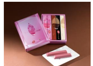
【初出店】 キットカットショコラトリー