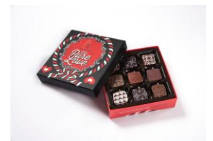
MAX BRENNER CHOCOLATE BAR