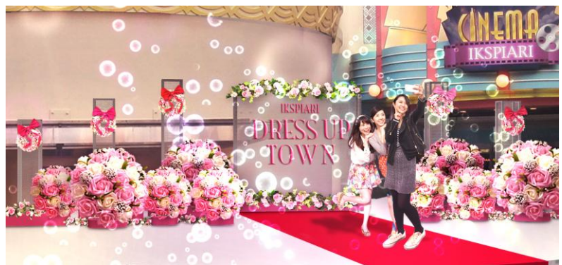
ドレスアップランウェイ