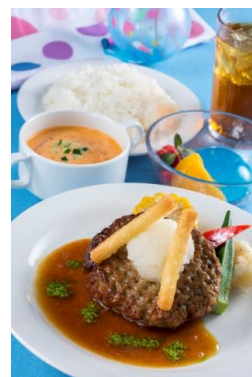
「プラザパビリオン・レストラン」 スペシャルセット 1,940円

そのほか、「れすとらん北齋」ではスーベニア箸付きの、見た目も鮮やかなちらし寿司のスペシャルメニューが登場します。