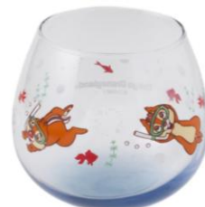
グラス 900 円 販売店舗：グランドエンポーリアム