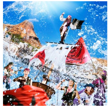
東京ディズニーシー 「ディズニー・パイレーツ・サマー」

また、プラザテラスには、縁日をイメージした装飾を施した屋台風のブースが登場し、グッズやメニュー、デコレーションなども、和の要素を取り入れたデザインで夏祭りを更に盛り上げます。