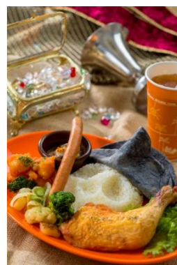
「ミゲルズ・エルドラド・キャンティーナ」 スペシャルセット 1,580 円