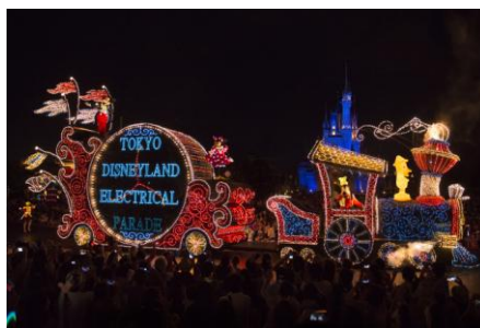
東京ディズニーランド・ エレクトリカルパレード・ ドリームライツ

ディズニー映画『アナと雪の女王』のアナとエルサを乗せた氷の城のフロートが夜のパレードに初めて登場するほか、ディズニー映画『シンデレラ』のフロートが生まれ変わります。また、2011年7月のリニューアル時に惜しまれつつも終了した、ディズニー映画『美女と野獣』のフロートも、LEDを採用し輝きを増し再登場するなど、新たに5台のフロートが加わり、夜のパークを一層美しく彩ります。