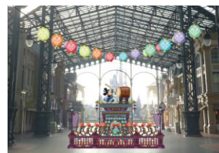
フォトロケーション (ワールドバザール)

ワールドバザールからプラザ周辺にかけて、和の要素がふんだんに盛り込まれたデザインのバナーやパラソル、提灯などのデコレーションが施され、ディズニーならではの夏祭りを盛り上げます。また、ワールドバザールの中央にはやぐらが登場し、その上で和太鼓をたたきミッキーマウスと、ディズニー映画『ファンタジア』に登場するほうきたちがやぐらの周りでうちわを片手に踊る様子を表現した新しいデコレーションが設置されます。