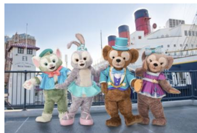
「ステップ・トゥ・シャイン」

また、ショーの途中には、ゲストの皆さまがキャラクターたちと触れ合うことのできるシーンもあり、ダッフィーやステラ・ルーたちをより一層身近に感じていただくことができます。