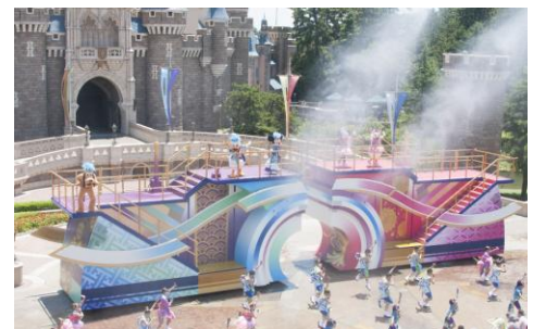
東京ディズニーランド 「ディズニー夏祭り」