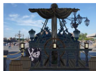
フォトロケーション