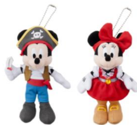
ぬいぐるみバッジ 各 1,700 円 販売店舗：エンポーリオ