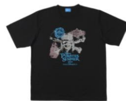
T シャツ 1,700 円 販売店舗：エンポーリオ

メディテレーニアンハーバー周辺には、ドクロが描かれた海賊の旗をイメージしたデコレーションや、黒や赤のパラソルが設置されるほか、海賊船に乗っているような写真や牢獄に閉じ込められたような写真を撮影できるフォトロケーションが登場します。