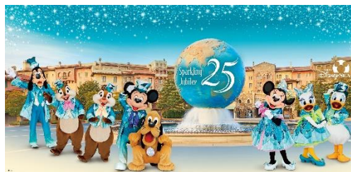
フォトスポットのイメージ

※詳細は東京ディズニーリゾート・オフィシャルウェブサイトにて 決まり次第お知らせします。