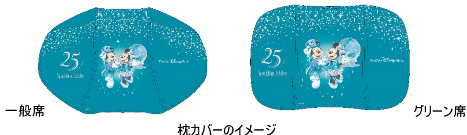
枕カバーのイメージ