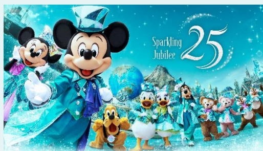
「東京ディズニーシー25周年 “スパークリング・ジュビリー”」

https://www.tokyodisneyresort.jp/treasure/tds25th/