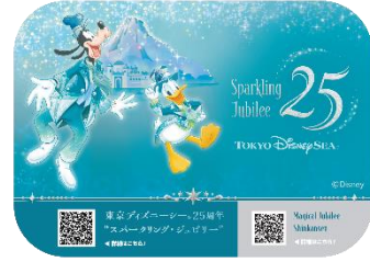
車内ステッカーのイメージ

今回の「Magical Jubilee Shinkansen」は、さまざまな海の魅力から着想を得た東京ディズニーシー25周年のテーマカラー「ジュブリーブルー」を基調に、アニバーサリーイベントの特別な衣装に身を包んだミッキーマウスやディズニーの仲間たち、そして東京ディズニーシーのシンボルでもあるディズニー・アクアスフィアやプロメテウス火山などが描かれ、東京ディズニーシー25周年の祝祭感を表現した特別な車両です。車内においても、座席の枕や車内メロディなどで「東京ディズニーシー25周年“スパークリング・ジュブリー”」の雰囲気を感じることができます。特別車両「Magical Jubilee Shinkansen」で、祝祭感あふれる新幹線の旅をお楽しみください。