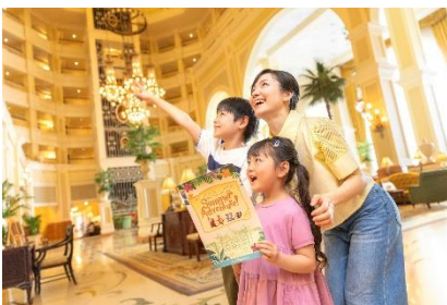
ラリープログラム体験イメージ