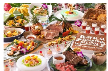
シェフ・ミッキー（buffet） ハワイアンスタイル・buffet （ランチ/ディナー）