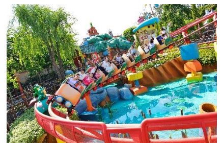
「ガジェットのゴーコースター」