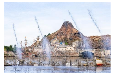
「“びしょ濡れ”ハーバースプラッシュ」

ピアッツァ・トポリーノでは、今年も「“びしょ濡れ”ハーバースプラッシュ」を実施します。大量の水によるびしょ濡れを楽しめるほか、スプラッシュタイムにはMrs. GREEN APPLEの「Carrying Happiness (Tokyo Disney Resort Version)」にのせてさらに勢いを増して噴き出す水と共に、楽しく涼しいびしょ濡れ体験で盛り上がってみませんか。