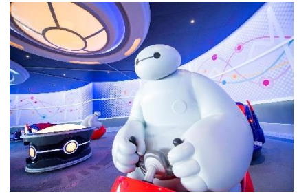
「ベイマックスのハッピーライド」

ベイマックスの仲間のケア・ロボットたちがゲストの乗ったライドを引っ張り、ゲストはその動きに想像以上に振り回されるこのアトラクション。明るく軽快な楽曲が加わることで、さらに笑顔があふれ、ハピネスレベルが上がることでしょう。