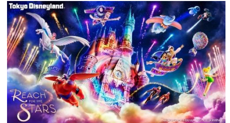
「Reach for the Stars」

2024 年から実施していた「Reach for the Stars」がファイナルを迎え、「Reach for the Stars : Everlasting Dreams」として実施します。7 月 2 日（木）からは、ショー本編の終了後に、この期間だけの楽曲に合わせた特別な演出が追加されます。シンデレラ城を舞台に、さまざまなキャラクターたちが夢を追って空を翔ける姿を描くキャッスルプロジェクションのファイナルをぜひ、お見逃しなく！