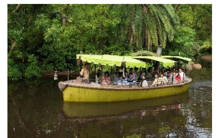
「ジャングルクルーズ： ワイルドライフ・エクスペディション」

「ジャングルクルーズ：ワイルドライフ・エクスペディション」では、ジャングルをこよなく愛する船長たちが“ジャングルで一番大切なことを伝えるツアー”を実施します。また、乗船したゲストにはジャングルで一番大切なことを学んだ証（ステッカー）も用意して、皆さんと一緒にジャングル探険に出発できることを楽しみにしています。