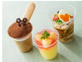
夏におすすめのメニュー

※グッズやメニューの内容は、予告なく変更になる場合があります。また、品切れや販売終了となる場合があります。