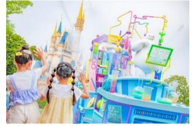
「ベイマックスのミッション・クールダウン」

パレードルートでは、ディズニー映画『ベイマックス』に登場するケア・ロボットのベイマックスが夏の暑さからゲストを守るために繰り広げるびしょ濡れプログラムを実施します。暑さによって低下したゲストの“エネルギーレベル”を上昇させるミッションを任せられたベイマックスは、“エネルギーレベル”が著しく低下しているエリアを検知するとフロートが停止し、水が放たれます。また、今年も“サマー・クールオフ”でコラボレーションする Mrs. GREEN APPLE の「Carrying Happiness (Tokyo Disney Resort Version)」を使用。明るく軽快な音楽とともに夏らしいプログラムをお楽しみください。