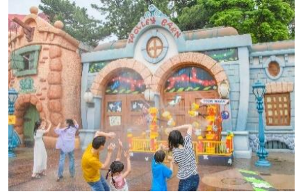
「“びしょ濡れ”トゥーンタウン」

トゥーンタウンでは、エリア内のジョリートロリーの車庫でクールミストや滝のような水が噴き出したり、トゥーンタウン消防署や花火工場から水が飛び出したりするびしょ濡れスポットが今年も登場します。大人の方もお子さまも、びしょ濡れになってお楽しみください。