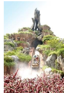
「スプラッシュ・マウンテン」

丸太のボートに乗り、約16mの高さから一気に滝つぼへと落下するアトラクション「スプラッシュ・マウンテン」では、今年の夏もスペシャルバージョン「スプラッシュ・マウンテン“もっと！びしょ濡れMAX”」を期間限定で実施します。昨年からはじめた“もっと！びしょ濡れMAX”では、大量の水がゲストにかかり、さらに迫力のある水しぶきを追加することで、乗車されているゲストはもちろん、周辺で見ているゲストにもさらなる爽快感をお届けします。