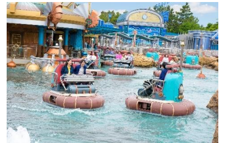
「アクアトピア “びしょ濡れ”バージョン」

自動運転のウォータービークルに乗って、予測不能な動きを楽しめるアトラクション「アクアトピア」では、今年も期間限定でびしょ濡れになるスペシャルバージョンを実施します。なお、アクアトピアは9月14日（月）を以てクローズします。最後に“逃げられないびしょ濡れ体験”の思い出をつくりませんか。