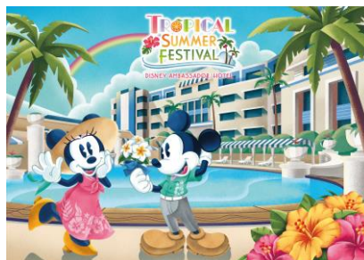
トロピカルサマーフェスティバル