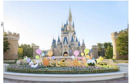
シンデレラ城前プラザのデコレーション