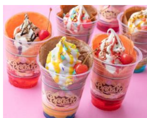
「アイスクリームコーン」で販売する パルパルーザ・パルフェ

イベント開催に先立ち 3 月 9 日（月）より、メニューやグッズで自分ならではの組み合わせをお楽しみいただけるパルパルーザ・パルフェが登場します。レストラン「アイスクリームコーン」では、ベース、ソース、トッピングの 3 つのステップで好きな組み合わせを選び、全 12 通りの中から好みのおパルフェをお召し上がりいただけます。また、ショップ「ペイストリーパレス」では、パルフェをイメージしたスイーツセットを販売します。カップまたはポーチの中にチョコレートやクッキーなどから好きなお菓子を 10 個詰めてオリジナルのスイーツセットを作ることができます。それぞれの店舗には、パルパルーザ・パルフェをイメージしたお菓子やパルフェの装飾も施されます。