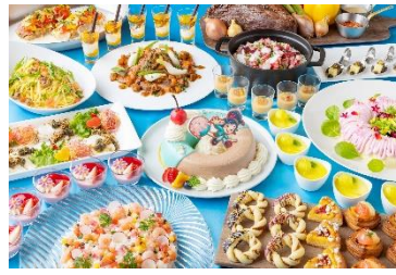
「シャーウッドガーデン・レストラン」（ブッフェ） ディズニー・パルパルーザ “ヴァネロペのスウィーツ・ポップ・ワールド” スペシャルブッフェ 提供期間：3月9日（月）～5月10日（日）