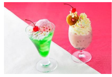
「ドリーマーズ・ラウンジ」（ロビーラウンジ） ディズニー・パルパルーザ “ヴァネロペのスウィーツ・ポップ・ワールド” スペシャルドリンク 提供期間：3月9日（月）～5月10日（日）