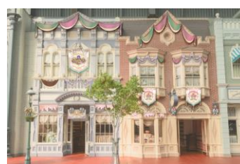
店舗の装飾(ペイストリーパレス)