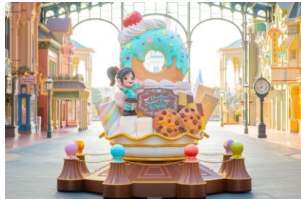
ワールドバザール内の スウィーツのフォトロケーション