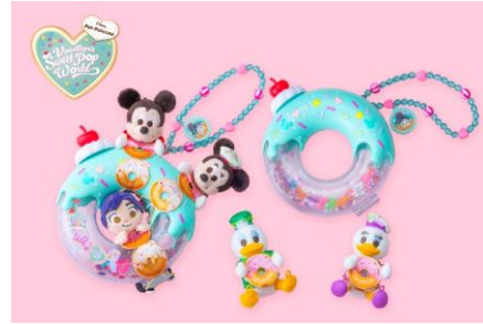
「ヴァネロペのスウィーツ・ポップ・ワールド」のスペシャルグッズ （左:3月9日発売、右:4月8日発売）

※スペシャルグッズの内容は、予告なく変更になる場合があります。また、在庫状況により、イベント期間中であっても品切れや販売終了となる場合や、イベント期間終了後も販売を継続する場合があります。