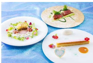
「カンナ」（創作料理） ディズニー・パルパルーザ “ヴァネロペのスウィーツ・ポップ・ワールド” スタイリッシュカンナ 提供期間：3月9日（月）～5月10日（日）

ディズニーホテルでも、とびきり楽しいスウィーツの世界に様変わりしたこの期間ならではのメニューを、ぜひお楽しみください。