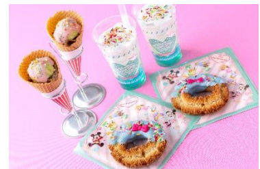
「ヴァネロペのスウィーツ・ポップ・ワールド」の スペシャルメニュー

「ヴァネロペのスウィーツ・ポップ・ワールド」のスペシャルメニューを、イベント開催に先立ち3月9日（月）より販売します。ヴァネロペをイメージしてデコレーションしたスペシャルドーナツ（レモン風味）が「ロイヤルストリート・ベランダ」に、スパークリングドリンク（ピーチ&グリーンアップルシロップ）が「ヒューイ・デューイ・ルーイのグッドタイム・カフェ」に登場。さらに、「ザ・ガゼーボ」では、アイスクリームのような見た目の牛カルピコーン（アボカドマヨネーズ&マッシュポテト）も楽しめます。