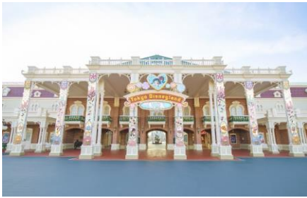
ワールドバザール入口のデコレーション

をお迎えします。シンデレラ城前プラザには、ディズニーの仲間たちをモチーフにしたロリポップのデコレーションが設置されます。