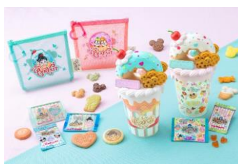
「ペイストリーパレス」で販売する パルパルーザ・パルフェ