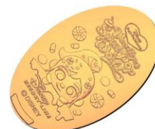
スーベニアメダル

※在庫状況により、イベント期間中であっても品切れや販売終了となる場合があります。