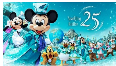
「東京ディズニーシー25 周年 “スパークリング・ジュビリー”」

世界初の海をテーマにしたディズニーテーマパークとして 2001 年に誕生した東京ディズニーシーは、2024 年に 8 つ目のテーマポートとなるファンタジースプリングスがオープンし、その魅力はさらに広がっています。そんな東京ディズニーシーの物語がきらめきを増しながら続いていくことを願い、25 周年を記念した華やかなアニバーサリーイベントが 2026 年 4 月に開幕します。