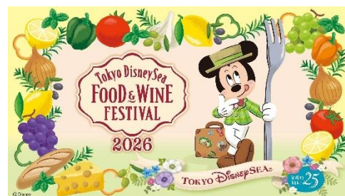
「東京ディズニーシー・ フード&ワイン・フェスティバル」