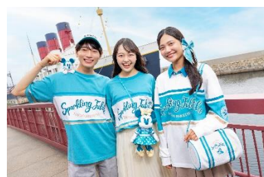
スタイリッシュで日常使いしやすいグッズ