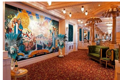
店内デコレーション