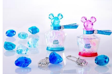
ジュビリーブルーメモリーズ

※内容は、予告なく変更になる場合があります。また、ジュビリーブルーに包まれた空間への入場には制限を設ける場合があります。