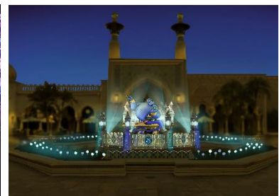
アラビアンコーストの環境演出