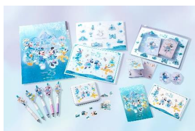
25周年の祝祭感にあふれた ジュビリーブルーのグッズ

ジュビリーブルーで彩られたパークで25周年をお祝いするディズニーの仲間たちが描かれたきらめきあふれるデザインのグッズや、ジュビリーブルーを取り入れたシンプルで日常使いしやすいデザインのグッズなど、25周年ならではのスペシャルグッズをアニバーサリーイベント開催に先駆けて2026年4月8日（水）より販売します。