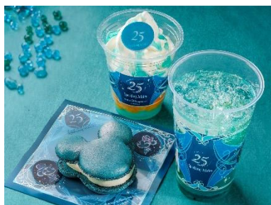
スペシャルメニュー

2026年4月15日（水）から6月30日（火）の期間では、“食で世界を巡る”をテーマにした「東京ディズニーシー・フード&ワイン・フェスティバル」を開催し、ゲストの皆さまを祝祭の旅へといざないます。東京ディズニーシーの異国情緒あふれる雰囲気の中で、各エリアならではの“食”をお楽しみいただけます。多彩な料理とワインをはじめ、この時期だけのさまざまなアルコール飲料やソフトドリンクをぜひご賞味ください。