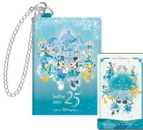
東京ディズニーシー・ホテルミラコスタ カードキー&キーケース