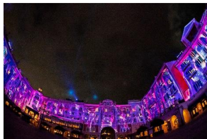
メディテレーニアンハーバーの環境演出 「スパークリング・ジュビリー・ナイト」