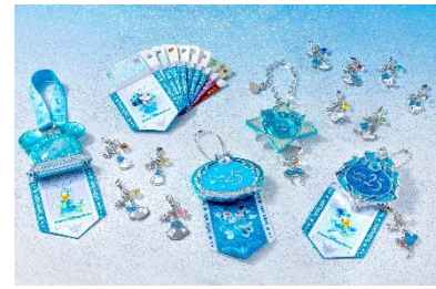
ジュビリーバッジ、リボン、 チャームなど

また、25周年をお祝いするキーアイテム「ジュビリーバッジ」も同日より販売します。お好きなバッジやリボン、チャームを組み合わせ、自分だけの「ジュビリーバッジ」へカスタマイズすることができます。家族やお友達同士で身につけてお祝いに参加してみてはいかがでしょうか。