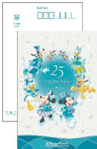
ポストカード（共通デザイン）