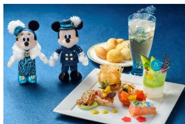
スペシャルメニュー、スペシャルグッズ