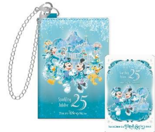
東京ディズニーシー・ファンタジースプリングスホテル カードキー&キーケース