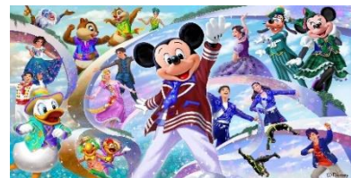
「ダンス・ザ・グローブ！」

アメリカンウォーターフロントのウォーターフロントパークでは、特別な舞台が準備され、2026 年 1 月 14 日（水）よりステージショー「ダンス・ザ・グローブ！」を公演します。ウォーターフロントパークでステージを使ったエンターテイメントショーは約 12 年ぶりとなります。