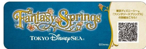
テーブルシールデザイン (グリーン車と7号車を除く)