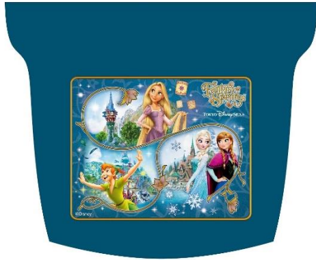
ヘッドカバーデザイン (グリーン車と7号車を除く)