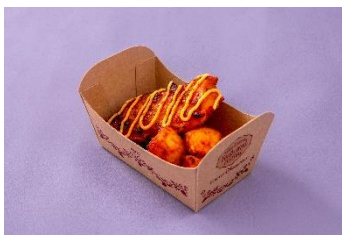
チーズソースのタンドーリチキン 650円 販売店舗:カスバ・フードコート