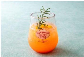
スパークリングカクテル(ピスコ&トロピカルフルーツシロップ) 880円 販売店舗:ユカタン・ベースキャンプ・グリル

ロストリバーデルタの「ユカタン・ベースキャンプ・グリル」では、メキシコの明るい太陽とみずみずしいフルーツが育つ南国をイメージしたカクテルや、ライムの効いたサルサソースを添えたガーリック風味のシュリンプフライが登場し、中央アメリカのジャングルの景色や雰囲気の中でお食事いただけます。また、ミステリアスアイランドの「ノーチラスギャレー」では、火山の赤いマグマをイメージし、柑橘系の香りが特徴のペッパーやカカオニブを火山灰に見立てたウイスキーベースのカクテルが登場します。そして、アラビアンコーストの「カスバ・フードコート」では、スパイシーな味わいのポテトを添え、チーズソースをトッピングしたタンドーリチキンが登場するなど、各テーマポートならではの味や見た目の料理やドリンクをお楽しみいただけます。そのほか、「ザンビーニ・ブラザーズ・リストランテ」で販売する、東京ディズニーシーのシンボル「東京ディズニーシー・アクアスフィア」をイメージした、混ぜるとオーロラのようにキラキラ輝くスパークリングドリンクなど、お子さまやお酒をお飲みにならない方もお楽しみいただけるソフトドリンクも多数登場します。