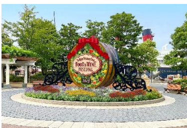
ウォーターフロントパークの デコレーション

「東京ディズニーシー・フード&ワイン・フェスティバル」に訪れるゲストを歓迎するデコレーションが、各レストランの店頭をはじめ、パーク全体に飾られます。フェスティバルの中心となるアメリカンウォーターフロントのニューヨークエリアは、春の訪れとフェスティバルの開催を知らせるように、色とりどりの花や大きなワイン樽をモチーフにしたデコレーション、ディズニーの仲間たちがフェスティバルに参加して楽しむ様子を描いたバナーで彩られます。また、ミッキーマウスが旅をしながら食を楽しむ姿が描かれたフォトスポットなども登場します。