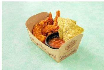
シュリンプフライ&サルサ 650円 販売店舗:ユカタン・ベースキャンプ・グリル