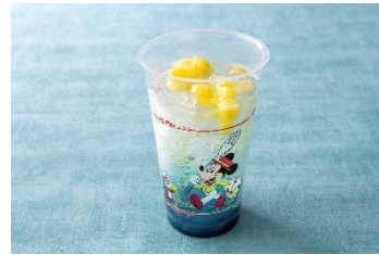
スパークリングドリンク(パイナップル&ココナッツ風味) 700円 販売店舗:ザンビーニ・ブラザーズ・リストランテ

また、「カフェ・ポルトフィーノ」や「ホライズンベイ・レストラン」、「ヴォルケイニア・レストラン」では、オードブルとさまざまな種類のビールやワインの飲み比べが楽しめるテイastingセレクションを販売します。オードブルとのペアリングや飲み比べを通して、お好みの組み合わせや味わいを発見してみるのはいかがでしょうか。