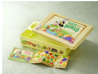
シーズナルグルメチケットセット 3,400円