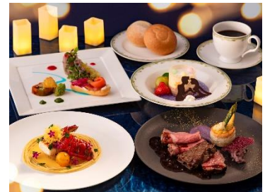
～シェフズ・イメージネーション～スペシャルコース 8,800円～13,400円 販売店舗:S.S.コロンビア・ダイニングルーム ※4月16日(水)～販売

「S.S.コロンビア・ダイニングルーム」や「マゼランズ」など、一部のテーブルサービスの店舗では、東京ディズニーシーのシェフが、ファンタジースプリングスのアトラクションからイメージネーションを広げて創作したコース料理をご提供します。「S.S.コロンビア・ダイニングルーム」で販売する～シェフズ・イメージネーション～スペシャルコースは、アトラクション「ラプンツェルのランタンフェスティバル」をテーマとしていて、ロマンティックなひとときを、お食事でも体験いただけます。