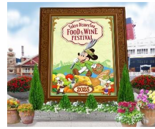
S.S.コロムビア号前のフォトスポット