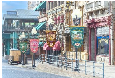
ディズニーの仲間たちがフェスティバルに 参加して楽しむ様子を描いたバナー