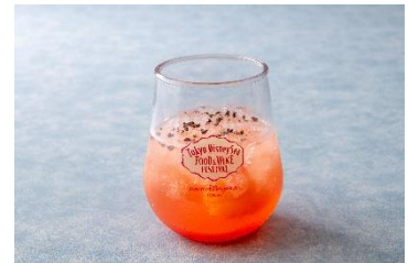
スパークリングカクテル(ウイスキー&シトラス) 880円 販売店舗:ノーチラスギャレー