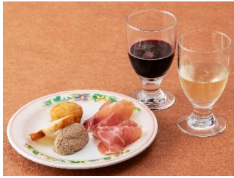
テイastingセレクション 1,800円 販売店舗:カフェ・ポルトフィーノ