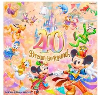
東京ディズニーリゾート 40 周年 “ドリームゴーラウンド”

2024年3月31日(日)まで開催中のアニバーサリーイベント「東京ディズニーリゾート 40 周年“ドリームゴーラウンド”」がいよいよグランドフィナーレを迎えます。ゲスト、キャスト、そしてディズニーの仲間たちの夢がひとつに繋がり、みんなでお祝いしてきた特別な1年。“夢がかなう場所”東京ディズニーリゾート 40 周年のグランドフィナーレをみんなと一緒に祝いましょう！