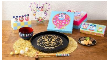
フィギュア 各 1,500円 しめ飾り 4,000円 お椀 1,300円 箸セット 2,400円 お盆 2,000円 おせんべい&おこし 1,700円 チョコレート 1,000円