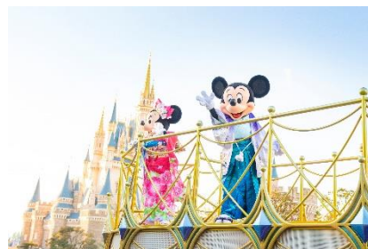
東京ディズニーリゾートのお正月のイメージ

そして、ディズニーホテルではお正月らしい祝祭感のあるスペシャルメニューを、ディズニーリゾートラインではミッキーマウスとミニーマウスのデザインと、ミッキーマウスをイメージしただるまがデザインされた2種類のフリーきっぷを販売します。