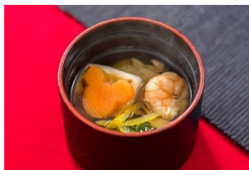
「れすとらん北齋」雑煮椀 お食事にセットの味噌汁からプラス 400円に変更できます