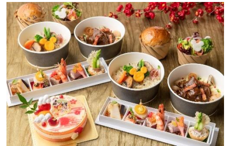
東京ディズニーランドホテル「カンナ」 イヤーエンド&ニューイヤー スタイリッシュカンナ 16,500円