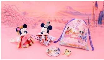
ぬいぐるみバッジ 各 2,500円 カンバッジ 500円 ピンバッジ 1,200円 きんちゃく 900円

また、2025年の干支のヘビをテーマにしたディズニーの仲間たちのぬいぐるみやぬいぐるみバッジを11月14日（木）から販売します。