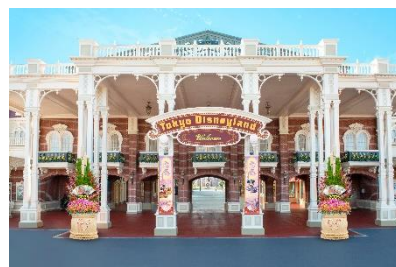
ワールドバザールの入口の デコレーションイメージ

また、東京ディズニーシーのミラコスタ通りの入口にもミッキーマウスとミニーマウスが描かれた門松が設置され、お正月の雰囲気を感じることができます。