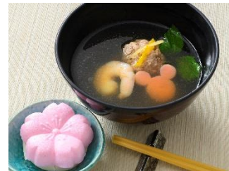
「レストラン櫻」雑煮椀 お食事にセットの味噌汁からプラス 700円に変更できます

※スペシャルメニューの内容は、予告なく変更になる場合があります。また、品切れや販売終了となる場合があります。