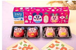
だるまスイーツ(4個入り) 1,500円