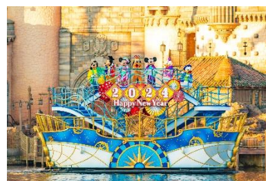
2024年の「ニューイヤーズ・グリーティング」の様子

2025年1月1日（水）から1月13日（月）までの間、お正月ならではの装飾が施された華やかな船に乗って、和服姿のミッキーマウスやミニーマウスをはじめとするディズニーの仲間たちがゲストの皆さまに新年のご挨拶をします。