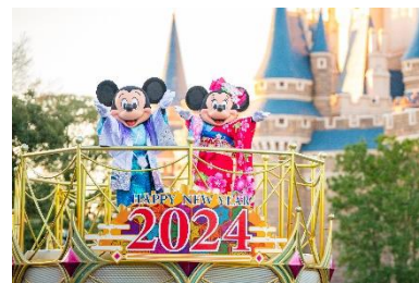
2024年の「ニューイヤーズ・グリーティング」の様子

2025年1月1日（水）から1月13日（月）までの間、和服姿のミッキーマウスやミニーマウスをはじめとするディズニーの仲間たちが、お正月ならではの装飾が施された華やかなフロートなどに乗って、新年の始まりをお祝いします。