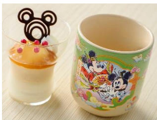
きなこムース&ミルクゼリー 550円 スーベニアカップ付きはプラス 650円

和服姿のミッキーマウスとミニーマウスが描かれた湯呑み形のスーベニアカップ付きデザートを、12月26日（木）より東京ディズニーランド「スウィートハート・カフェ」、東京ディズニーシー「ザンビーニ・ブラザーズ・リストランテ」で販売します。優しい甘さのミルクゼリーときなこのムースに白玉とみたらしの餡が添えられた、和を感じていただけるデザートです。また、2025年1月1日（水）から1月5日（日）の期間限定で、雑煮椀を販売します。東京ディズニーランドの「れすとらん北齋」では、柚子の爽やかな香りが漂うすまし仕立ての雑煮椀をご用意します。東京ディズニーシーの「レストラン櫻」では、鴨のつみれが入った雑煮椀をお楽しみいただけます。桜を模した麩と焼き餅は別添えで提供され、見た目にも華やかな一品です。どちらのお店でもお食事膳の味噌汁を雑煮椀に変更することができます。