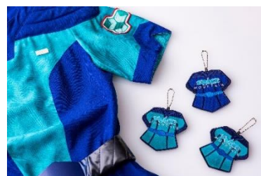
ワッペンバッジ 3,500 円