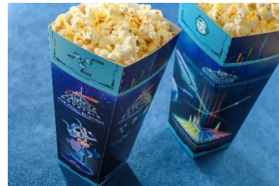
ポップコーン、レギュラーボックス （ソルト味） ¥400

※スペシャルメニューの内容は、予告なく変更になる場合があります。また、品切れや販売終了となる場合や、イベント終了後も販売する場合があります。