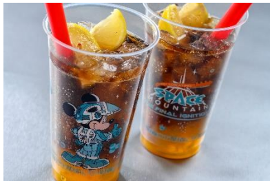
スパークリングゼリードリンク （コカ・コーラ&レモン・バニラ） ¥700

東京ディズニーランドでは、「セレブレーション・スペース・マウンテン：ザ・ファイナルイグニッション！」をより一層お楽しみいただけるスペシャルメニューを、4月1日（月）から先行販売します。「トゥモローランド・テラス」では、パッションフルーツゼリーとレモンが入ったスパークリングゼリードリンク（コカ・コーラ&レモン・バニラ）を販売します。バニラビーンズのエッセンスが加わり、爽快感とバニラならではの甘い香りをお楽しみいただけるドリンクです。また、トゥモローランドをはじめとしたパーク内の一部のポップコーンワゴンでは、「セレブレーション・スペース・マウンテン：ザ・ファイナルイグニッション！」をイメージしたミッキーマウスがデザインされたレギュラーボックスが登場します。写真に撮るのも楽しい、この期間だけのレギュラーボックスに入ったポップコーンをお楽しみください。