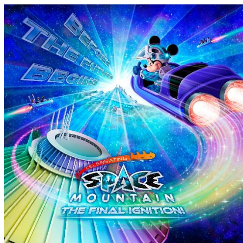
スペシャルイベント 「セレブレーション・スペース・マウンテン： ザ・ファイナルイグニッション！」