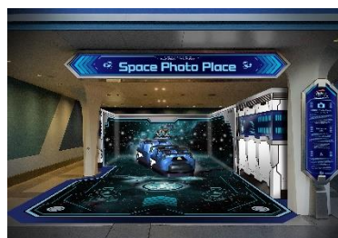
フォトロケーション