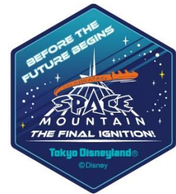
オリジナルデザインシール

イベント期間中、トゥモローランドでは、アトラクション利用にかかわらず、ゲストへのこれまでの感謝をこめて、イベント限定のオリジナルシールを配布します。詳しくは、東京ディズニーリゾート・オフィシャルウェブサイトをご確認ください。