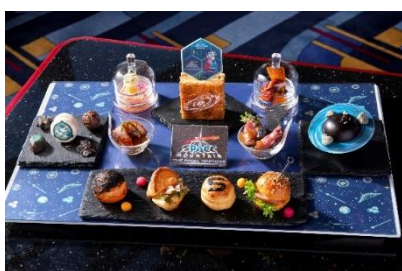
「セレブレーション・スペース・マウンテン：ザ・ファイナルイグニッション！プレミアムスイーツセット」

ディズニーアンバサダー®ホテル「ハイピリオン・ラウンジ」（ロビーラウンジ）では、宇宙空間をプレートいっぱいに表示したスペシャルメニュー「セレブレーション・スペース・マウンテン：ザ・ファイナルイグニッション！プレミアムスイーツセット」を提供します。惑星などをイメージしたメニューを堪能しながら、「スペース・マウンテン」での宇宙旅行を思い出してみたいはいかがでしょうか。