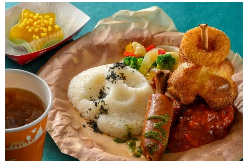
スペシャルセット 2,140円 提供店舗：ユカタン・ベースキャンプ・グリル

※スペシャルメニューの内容は、予告なく変更になる場合があります。また、品切れや販売終了となる場合や、イベント終了後も販売する場合があります