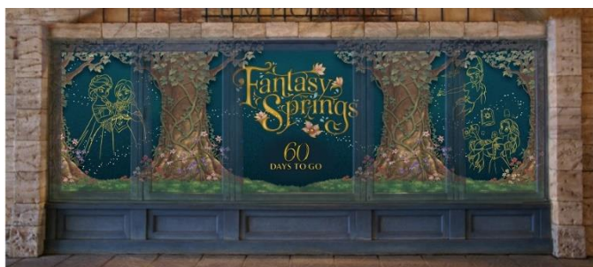
「エンポーリオ」のウィンドウディスプレイ