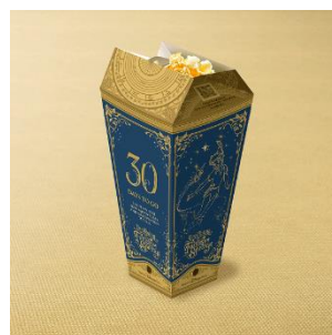
ポップコーン、レギュラーボックス

※ウィンドウディスプレイとミラコスタ通り入口でのカウントダウンはオープン日の60日前（4月7日）から、ポップコーンのレギュラーボックスでのカウントダウンはオープン日の30日前（5月7日）から実施します ※ポップコーンの販売内容は、予告なく変更になる場合があります。また、品切れや販売終了となる場合や、イベント終了後も販売する場合があります