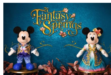
ぬいぐるみバッジ 各2,600円

※スペシャルグッズの内容は、予告なく変更になる場合があります。また、在庫状況に販売終了となる場合や、イベント期間終了後も販売を継続する場合があります