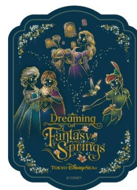
オリジナルデザインシール