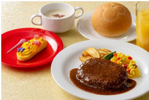
スペシャルセット 2,740円 提供店舗：ホライズンベイ・レストラン

「ユカタン・ベースキャンプ・グリル」では、プレート全体でディズニー映画『ピーター・パン』に登場するネバーランドを彷彿とさせるスペシャルセットを販売します。ハンバーグ、ポップオーバー、チーズフライを重ねた盛り付けや、ドクロ形のバターライスでネバーランド全体を表現しているプレートと、ピクシーダストをイメージしたチョコが飾られた星形のデザートセットをご提供します。