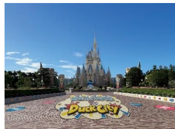
ダックシティの風景(プラザ)