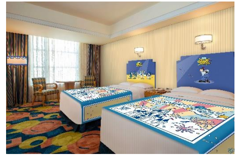
「ディズニー・パルパルーザ“Donaldのクワッキー・ダックシティ”」スペシャルルーム

※東京ディズニーランドホテルのスペシャルメニューは2024年4月1日（月）、ディズニーアンバサダーホテルのスペシャルメニューは2024年4月8日（月）より先行販売します