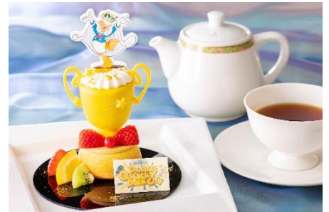
「ディズニー・パルパルーザ“Donaldのクワッキー・ダックシティ”」ケーキセット （ハイピリオン・ラウンジ）2,500円