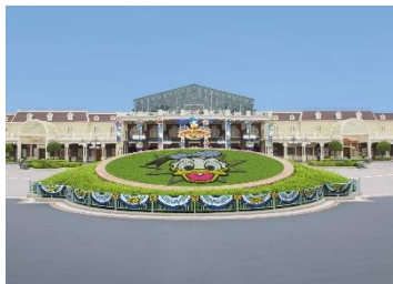
エントランスのドナルド花壇

ドナルドの理想の街“ダックシティ”ならではの、ユニークでハチャメチャな世界が広がります。ドナルド花壇や、大きなドナルドのマーキーがゲストの皆さんをお出迎え。ワールドバザール中央にはスーパースターとなったドナルドのモニュメントのほか、いたるところに、ダックシティらしいユニークな装飾が施されます。