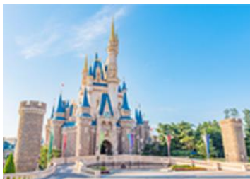
鑑賞エリア 「キャッスル・フォアコート」

「東京ディズニーリゾート・バケーションパッケージ」では、スペシャルイベント「Donaldのクワッキー・ダックシティ」のエンターテイメントプログラム「クワッキーセレブレーション★Donald・ザ・レジェンド！」をキャッスル・フォアコートの鑑賞エリアやバケーションパッケージ専用の鑑賞席からご覧いただけるプランを販売します。