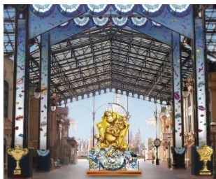
ワールドバザール内の モニュメント