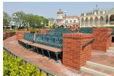
バケーションパッケージ専用鑑賞席 「ブラザガーデン」