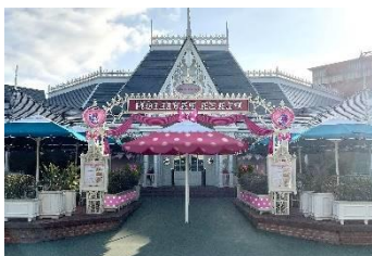
プラザパビリオン・レストランの デコレーションのイメージ

プラザパビリオン・レストランでスペシャルメニューをご購入された方に、「ミニーのファンダーランド」限定デザインのランチョンマットをお渡しします。また、プラザパビリオン・レストラン限定のスーベニアコースター付きのスパークリングゼリードリンクも先行販売します。