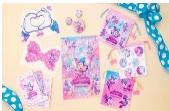
ポストカードセット 750 円 クリアホルダーセット 900 円 カンバッジセット 1,100 円 きんちゃくセット 2,400 円

ミニーが夢に描いたファンタジーな世界をイメージした、ピンクなどの色合いがポップでキュートなグッズが登場するほか、カチューシャやショルダーバッグ、ぬいぐるみバッジなど、パークを楽しむのにぴったりなグッズも販売します。