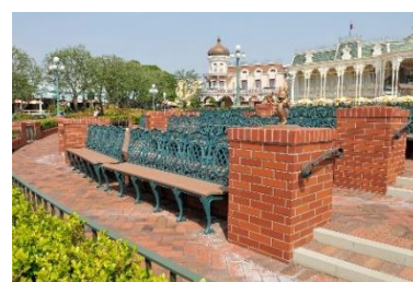
バケーションパッケージ専用鑑賞席「プラザガーデン」

※「【冬限定】アトラクションもショーもキャラクターグリーティングも楽しむ 2DAYS」で会えるミッキーとミニーの衣装は「ミニーのファンダーランド」のエンターテイメントプログラムの衣装とは異なります。