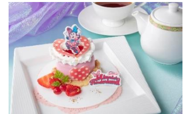
ディズニー・パルパルーザ“ミニーのファンダーランド”ケーキセット （ハイピリオン・ラウンジ）2,500円