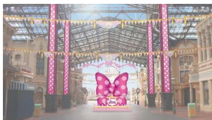
ワールドバザール内の リボン型のモニュメント