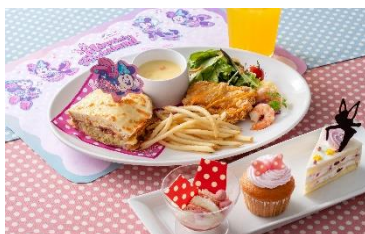
(奥)ミニーのキュートクラシックセット 1,980円、 (手前)スイーツセット 1,580円 (手前中央)ストロベリーマフィン 単品 550円