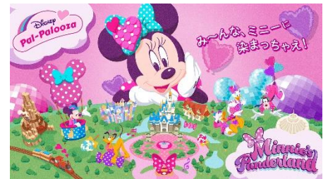
「ミニーのファンダーランド」(イメージ)

“パルパルーザ”のパルは「仲間」、パルーザは「みんなで盛り上がるパーティー」という意味から組み合わせた言葉で、「仲間と一緒に、はしゃいで、遊んで、最高に楽しめる」をコンセプトにしたスペシャルイベントシリーズです。シリーズ第1弾は、「ミニーのファンダーランド」。“ミニーマウスが夢に描いた大好きなものでいっぱいのファンタジーな世界”をテーマに、ポップでキュートな世界に様変わりしたパークをお楽しみいただけます。