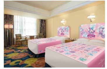
ディズニーアンバサダーホテル「ディズニー・パルパルーザ“ミニーのファンダーランド”」 スペシャルルーム