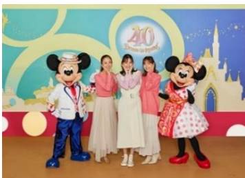
プラン「【冬限定】アトラクションもショーもキャラクターグリーティングも楽しむ 2DAYS」でディズニーの仲間たちとの記念撮影のイメージ

「東京ディズニーリゾート・バケーションパッケージ」では、スペシャルイベント「ミニーのファンダーランド」のエンターテイメントプログラム「ミニー@ファンダーランド」をバケーションパッケージ専用の鑑賞席からご覧いただけるほか、2024年1月から3月限定の衣装に身を包んだミニーとの記念撮影もお楽しみいただけるプランを販売します。