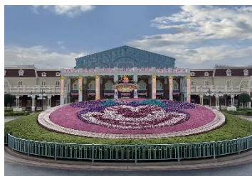
エントランスのミニー花壇

パークはミニーの大好きなものであふれ、いつものパークから様変わりしたポップでキュートな世界が広がります。エントランス前にはミニー花壇、ワールドバザールには大きなリボンのモニュメント、シンデレラ城正面のプラザの床面には水玉デザインのカーペットなどをお楽しみいただけます。