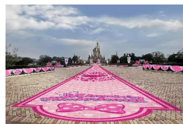
プラザに敷かれた カーペット調のデコレーション