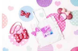
カチューシャ 2,200 円 ヘアアクセサリー 1,500 円 ショルダーバッグ 2,900 円 トートバッグ 5,500 円