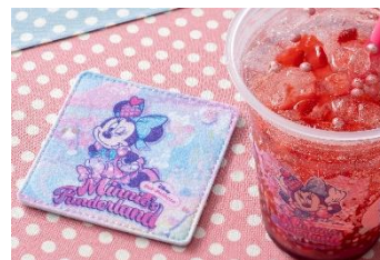
スパークリングゼリードリンク (フラワーシロップ&ストロベリー) スーベニアコースター付き1,000円 ※コースターは全3種類のうち 1つをランダムに提供します

※レストランの装飾は、2024年1月9日（火）から3月19日（火）の期間で実施します