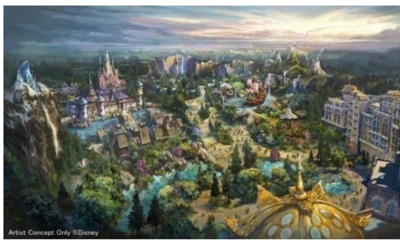
「ファンタジースプリングス」全景

「ファンタジースプリングス」は、ディズニー映画を題材とした3つのエリアである「フローズンキングダム」（『アナと雪の女王』をテーマとしたエリア）、「ラプンツェルの森」（『塔の上のラプンツェル』をテーマとしたエリア）、「ピーターパンのネバーランド」（『ピーター・パン』をテーマとしたエリア）と、1つのディズニーホテル「東京ディズニーシー・ファンタジースプリングスホテル」で構成されます。「魔法の泉が導くディズニーファンタジーの世界」をテーマとする総開発面積約140,000㎡（うち、テーマパーク・ホテルエリア約100,000㎡）にわたるエリアに、アトラクション、レストラン、ショップ、ホテルなどの新しい施設を導入します。