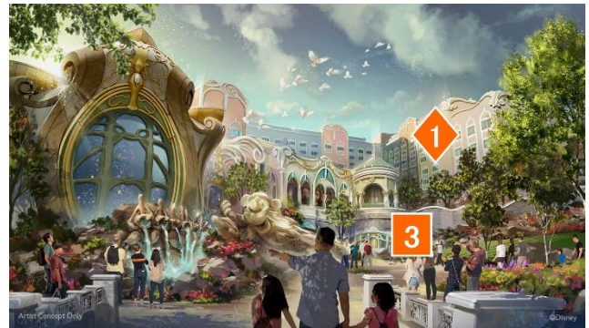
「東京ディズニーシー・ファンタジースプリングスホテル」 パーク内からみたファンタジーシャトーの外観