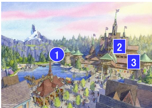
「フローズンキングダム」全景

「フローズンキングダム」は、雪の女王であるエルサが雪や氷を操る魔法の力を受け入れ、ディズニー映画『アナと雪の女王』が幕を閉じた後の幸せな世界です。映画のストーリーをたどるアトラクション「アナとエルサのフローズンジャーニー」では、ボートに乗って、「真実の愛」が凍った心を溶かす壮大かつ心温まる姉妹の物語を、映画の名曲とともに楽しむことができます。また、アレンデール城の中には、屋内のダイニングエリアのほか、遠くにフィヨルドの崖や山が見える屋根付きの屋外ダイニングエリアがあるレストラン「アレンデール・ロイヤルバンケット」と、映画に登場するサウナ付きの山小屋の主人オーケンが経営する「オーケンのオーケーフード」がオープンします。