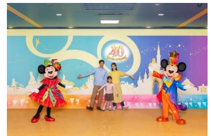
40周年の衣装を身にまとったディズニーの仲間たちと記念撮影

また、昼のパレード「ディズニー・ハーモニー・イン・カラー」などのエンターテインメントのほか、人気のアトラクションやキャラクターグリーティング施設などをお楽しみいただける「2つのパークを満喫する 2DAYS/3DAYS」が登場します。また、パッケージだけの特別なひとときをお過ごしいただける