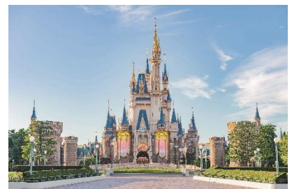
シンデレラ城に設置されるデコレーション