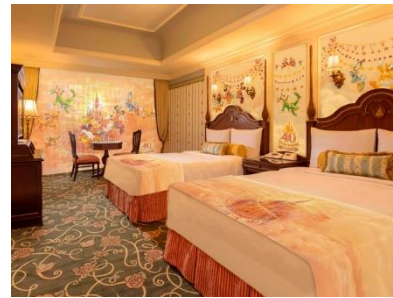
東京ディズニーランドホテル 東京ディズニーリゾート40周年“ドリームゴーラウンド” スペシャルルーム

※東京ディズニーランドホテル、ディズニーアンバサダーホテル、東京ディズニーシー・ホテルミラコスタで用意するポストカードの一例です。