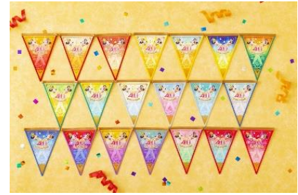
スペシャルグッズとして販売する ドリームガーランド

40周年イベント期間中のパークを盛り上げる大切なアイテムが「ドリームガーランド」です。ゲストもキャストもディズニーの仲間たちもガーランドのように繋がって、みんなで一緒に40周年を盛大にお祝いしようという思いが込められています。キャストは、ネームタグアクセサリーとしてさまざまな色のガーランドを身につけてゲストをお迎えします。またゲストは、スペシャルグッズとして販売する色とりどりの「ドリームガーランド」をアクセサリーとして身につけたり、コレクションして繋げてお部屋に飾ったりと、パークでもお家でも40周年のイベントをお楽しみいただけます。パークのいたるところで、「ドリームガーランド」が飾られ、40周年の祝祭を華やかに演出します。