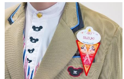
40周年のデザインのネームタグと ドリームガーランドのネームタグアクセサリー

キャストは40周年のデザインのネームタグと、さまざまな色の「ドリームガーランド」をネームタグアクセサリーとして身につけるほか、パークの各所で、集まったキャストとゲストと一緒に、40周年のテーマソングとともに盛り上がる「ドリームゴーラウンドタイム！」を実施するなどして、お祝いを彩ります。また、希望するゲストには40周年をお祝いする「ドリームガーランドシール」をお渡しします。キャストもゲストもみんな「ドリームガーランド」や「ドリームガーランドシール」を身につけ、一緒に繋がってこの特別な1年をお祝いします。