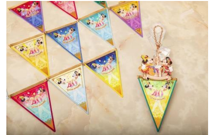
バッグチャームの使用例

パークのレストランがセレクトできるプランでは、40周年のスペシャルメニューが楽しめたり、パーク内の対象店舗で対象のソフトドリンクが飲み放題となるフリードリンク券では、新しく登場する40周年のスペシャルドリンクが何度でも利用できたりと40周年のメニューを堪能することができます。またプランに含まれるオリジナルグッズでは、ミッキーマウスとミニーマウスが40周年をお祝いしているデザインの、ローズゴールドを基調とした「バッグチャーム」もお選びいただけます。お好きなカラーのドリームガーランドと合わせてお使いいただくのもおすすめです。