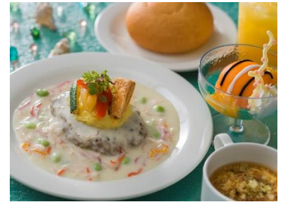
スペシャルセット 2,680円

東京ディズニーシーでは、アトラクションをイメージした見た目にも楽しいメニューで、東京ディズニーリゾートの40周年をお祝いします。ポートディスカバリーにある「ホライズンベイ・レストラン」では、アトラクション「アクアトピア」をイメージしたメニューが登場します。ハンバーグをアトラクションに見立て、海藻をイメージした具材の入ったホワイトソースで水面を表現。また、セットのデザートはサンゴ礁の海をイメージ。ブルーゼリーで海を、オレンジパッションムースで魚を表現し、サンゴをイメージしたチョコをトッピングしています。