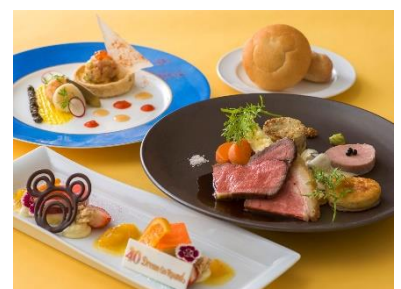
スペシャルコース 7,000円