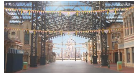
ワールドバザール内に設置される ドリームガーランド

ディズニーホテルでも、40周年の飾りつけや、特別プログラム、限定アイテムをご用意し、ゲストの皆さまをお迎えします。ディズニーリゾートラインでは、40周年を記念したラッピングモノレールが運行し、東京ディズニーリゾート全体で“ドリームゴーラウンド”を感じていただけます。