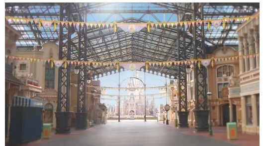
ワールドバザール内に設置される ドリームガーランド

そのほか東京ディズニーシーのミラコスタ通りの入口や東京ディズニーランドに続くペDESTリアンデッキにも40周年をお祝いするデコレーションが施され、東京ディズニーリゾート全体でこの特別な1年を盛り上げます。