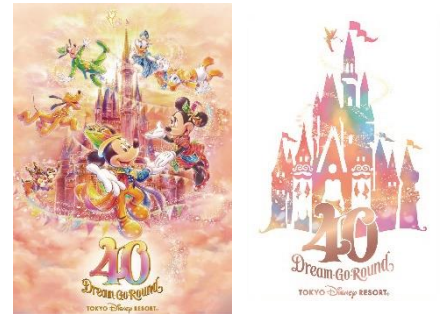
スペシャルグッズのデザインアート 一例

「ブルーバイユー・レストラン」では過去に人気のあったメニューをアレンジし、コースの一部に取り入れたスペシャルメニューをご用意します。過去提供していた“豚フィレ肉ときのこのクリームソース”をアレンジしたメニューと定番のローストビーフを合わせたメインディッシュや色鮮やかな前菜など40周年の特別感を感じていただけます。