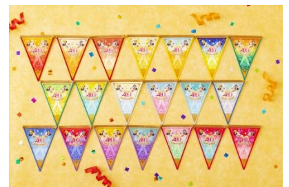
ドリームガーランド 各種