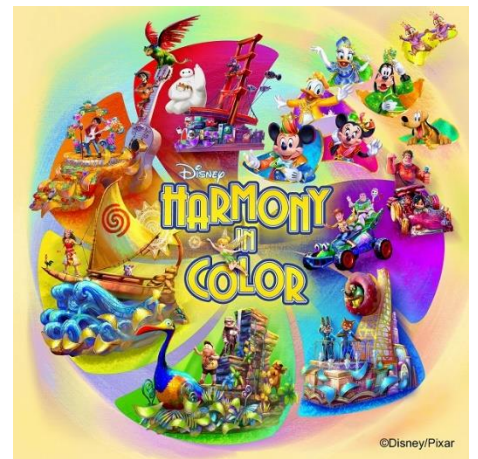
「ディズニー・ハーモニー・イン・カラー」

ミッキーマウスやおなじみの仲間たちのほか、ディズニー映画『ズートピア』やディズニー&ピクサー映画『リメンバー・ミー』などのキャラクターも登場します。