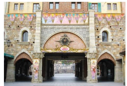
東京ディズニーシーに設置される ドリームガーランド