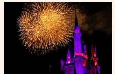
「ナイトハイ・ハロウィーン」

※各エンターテイメントプログラムは、公演回数が増える場合や、天候等の状況により内容が変更または中止になる場合があります