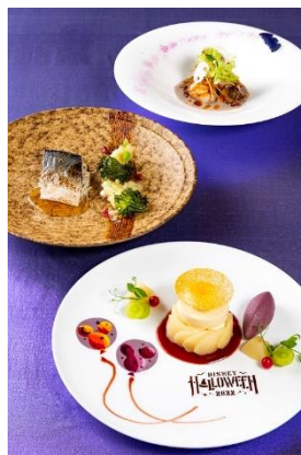
東京ディズニーランドホテル 「カナナ」 “ディズニー・ハロウィーン” プレシャスカナナ ※ランチのみの提供となります