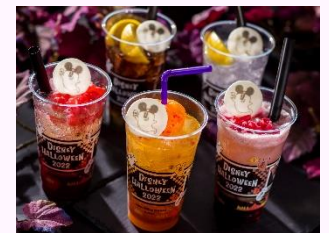
スペシャルドリンク各種

東京ディズニーシーでは、「リストランテ・ディ・カナレット」でハロウィーンの雰囲気表現したスペシャルコースを提供します。シーフードのサラダとハロウィーンらしい食材のカボチャを用いたタルトを合わせた前菜、マグロのほほ肉ときのこを具材に、赤ワイン入りのクリームソースでコクのある味わいに仕上げたパスタなど、この時期ならではの食材を取り入れたコースをお楽しみいただけます。