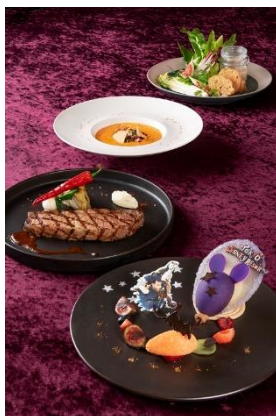
ディズニーアンバサダーホテル 「エンパイア・グリル」 “ディズニー・ハロウィーン”エンパイア・ グリル・ディナー

※スペシャルメニューは9月4日（日）より先行販売いたします ※スペシャルメニューの内容は、予告なく変更になる場合があります。また、品切れや販売終了となる場合があります ※オリジナルグッズには数に限りがございます。なくなり次第終了となります