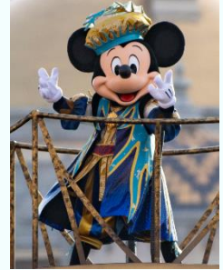
東京ディズニーシー 「ディズニー・ハロウィーン・グリーティング」 ミッキーマウスのコスチュームイメージ

東京ディズニーシーでは、「ディズニー・ハロウィーン・グリーティング」を公演します。このエンターテイメントプログラムでは、2019 年にメディテレーニアンハーバーで公演した「フェスティバル・オブ・ミスティーク」のコスチュームに身を包んだミッキーマウスやディズニーの仲間たちが登場し、ゲストの皆さまにご挨拶します。