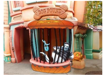
東京ディズニーランド 「トゥーンタウン」の 期間限定フォトスポット

そのほかにも、東京ディズニーランドでは、パークで人気がある一部のフォトスポットが期間限定でハロウィーン仕様となり、いつもとひと味違う写真を撮ることができます。