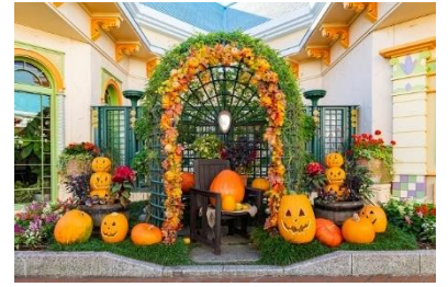
デコレーションの様子

舞浜駅前の商業施設イクスピアリでは、9月下旬からハロウィーン気分を楽しめるデコレーションが登場するほか、約 140 店舗のショップやレストラン、シネマコンプレックスなどをお楽しみいただけます。