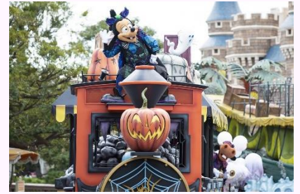
「スプーキー“Boo!”パレード」

東京ディズニーランドのパレードルートでは 3 年ぶりに、「スプーキー“Boo!”パレード」を過年度と内容を一部変更して公演します。このエンターテインメントプログラムでは、ゴースト仕様のコスチュームに身を包んだミッキーマウスとミニーマウスやディズニーの仲間たちが“お墓だらけのシンデレラ城”をイメージしたフロートや、“スケルトンが運行するウエスタンリバー鉄道”をイメージしたフロートなどに乗って登場し、ゲストの皆さまをゴースト流のゾクゾクワクワクする世界へと誘います。