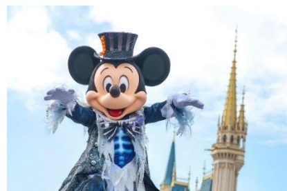
東京ディズニーランド 「スプーキー“Boo!”パレード」 ミッキーマウス イメージ

東京ディズニーランド では、ゴースト仕様のコスチュームに身を包んだミッキーマウスやミニーマウスとディズニーの仲間たちが登場し、ゲストの皆さまをゴースト流のゾクゾクワクワクする世界へと誘う「 スプーキー“Boo!”パレード 」と、ディズニーヴィランズが妖しくも魅惑的なヴィランズ流のハロウィーンの世界へとゲストを誘うパレード「 ザ・ヴィランズ・ロックン・ハロウィーン 」を公演します。また、パークで人気のある一部のフォトスポットが期間限定でハロウィーン仕様となり、ユーモアあふれる写真をご撮影いただけます。