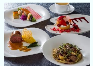
「リストランテ・ディ・カナレット」 スペシャルコース 5,500円

そのほか、メイプルパンプキン味のチュロス（東京ディズニーランドでも販売）や、チョコレートベースでダークな色合いが表現されたスペシャルドリンクや色とりどりのカクテルも販売します。