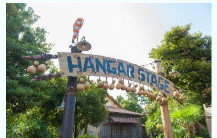
「ハンガーステージ」外観

ハンガーステージでは、エンターテイメントプログラム「ハロウィーンタイム・ウィズ・ユー」を公演します。パークを彩ってきた印象的なエンターテイメントの映像とともに、これまで東京ディズニーシーのハロウィーンに登場した妖しくも魅惑的な面々が再び登場し、ゲストの皆さまを東京ディズニーシーならではのハロウィーンの世界へ誘います。