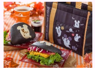
「スイートハート・カフェ」 スペシャルセット、 スーベニアランチケース付き 2,370円

そのほか、「ディズニー・ハロウィーン」ならではのワクワク感あふれる5種類のスペシャルドリンクが新登場します。それぞれのレストランによって異なる、あっと驚く見た目のドリンクなどをお楽しみいただけます。