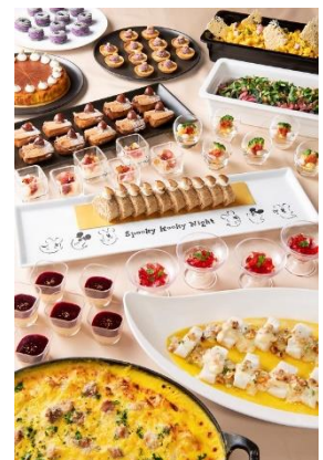
東京ディズニーシー・ホテルミラコスタ 「オチェアノ」 “ディズニー・ハロウィーン”buffet