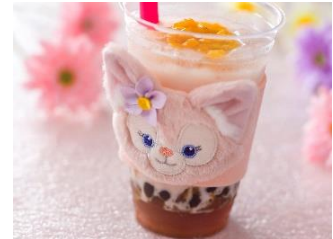
リーナ・ベルのタピオカティー(フルーツ&ミルク) スーベニアスリーブ付き 1,500円