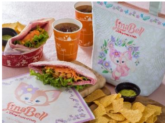
ミゲルのおすすめセット、 スーベニアランチケース付き 2,500円

レストラン「ミゲルズ・エルドラド・キャンティーナ」では、9月8日(木)より辛味のある豆とカレー風味の野菜などが入ったピタサンドがメインのセットを販売し、リーナ・ベルがデザインされたランチケースをつけてお楽しみいただけるほか、リーナ・ベルを表現したホイップバターがかわいらしいプレートセットを販売します。また、リーナ・ベルをモチーフにしたスーベニアと一緒に楽しみいただけるデザートやドリンク、ポップコーンバケットやミニスナックケースなども登場します。