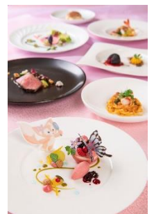
東京ディズニーシー・ホテルミラコスタ 「ベッラヴィスタ・ラウンジ」 グルメディナーコース

コースメニューでは、秋の食材を存分にご堪能いただけるほか、前菜やデザートにはリーナ・ベルをイメージしたモチーフをあしらひ、目にも楽しい料理をお楽しみいただけます。