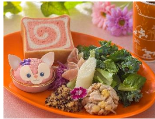
リーナ・ベルのデリプレートセット 1,800円