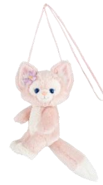
ショルダーバッグ 3,200円