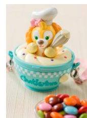
「ドックサイドダイナー」 カラフルチョコレート、 ミニスナックケース付き

また、レストランの入口や店内には、クッキー・アンにちなんだデコレーションが施されており、この時期だけの特別な雰囲気をお楽しみいただけます。