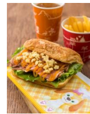
「ドックサイドダイナー」 スペシャルメニュー

「クッキー・アンのグリーティングドライブ」で盛り上がるアメリカンウォーターフロントのレストラン「ドックサイドダイナー」には、好奇心旺盛でいろいろなものをミックスしたり、楽しい食べものを作ったりすることが得意なクッキー・アンらしいメニューが登場します。デニッシュにローストビーフとチーズ&ペッパー味のクランブル、ロメインレタスなどが組み合わせられ、まるでシーザーサラダそのものがサンドされたかのような味わいと食感が楽しめるメニューです。