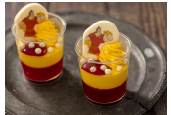
スウィート・ガストン 1個 450円