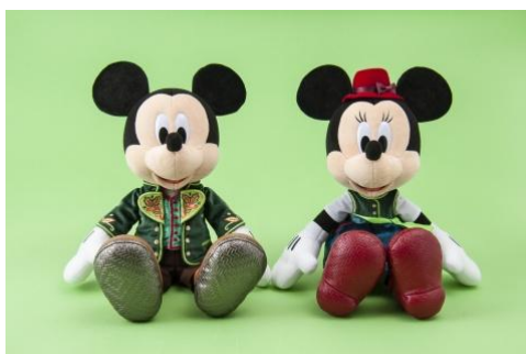
ぬいぐるみ 各 5,100 円

エンターテイメントプログラム「ミッキーのマジカルミュージックワールド」に登場する、ミッキーマウスやディズニーの仲間たちのコスチュームをモチーフにしたぬいぐるみとぬいぐるみバッジを約 15 種類販売します。