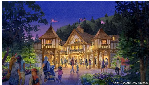
「ファンタジーランド・フォレストシアター」の外観