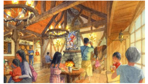
「ラ・タベルヌ・ド・ガストン」の内観

また、このレストランではガストンさながらに豪快にかぶりつける骨付きソーセージ入りのクロワッサンやチーズのフレーバーが香る甘塩っぱいフレンチトーストのサンド、彼が大好きなビールをイメージしたソフトドリンクなどをお召し上がりいただけます。映画『美女と野獣』の世界に飛び込んだような気分でお食事を楽しんでみてはいかがでしょうか。