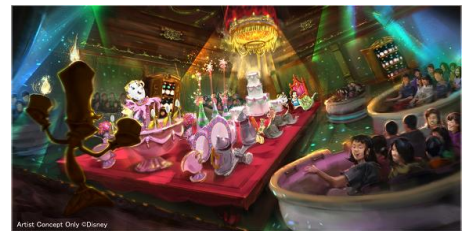
「美女と野獣“魔法のものがたり”」の内観