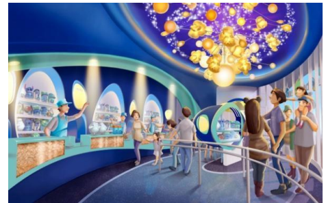
「ビッグポップ」の内観