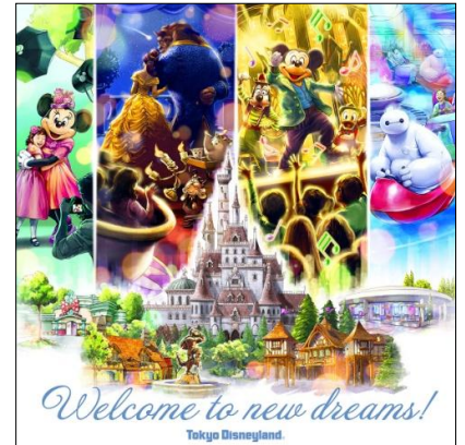
2020年4月15日にオープンする各施設のイメージ

ファンタジーランドを拡張して誕生する“ニューファンタジーランド”。ここには大型アトラクション「美女と野獣“魔法のものがたり”」や商品施設、フード施設など、ディズニー映画『美女と野獣』の世界が広がるほか、屋内シアター「ファンタジーランド・フォレストシアター」がオープンし、エンターテインメントプログラム「ミッキーのマジカルミュージックワールド」の公演が始まります。また、トゥモローランドにはアトラクション「ベイマックスのハッピーライド」やポップコーン専門ショップ、トゥーンタウンにはキャラクターグリーティング施設「ミニーのスタイルスタジオ」などがオープン。バラエティに富んだ複数の施設が、ゲストの皆さまにさまざまな体験を提供します。