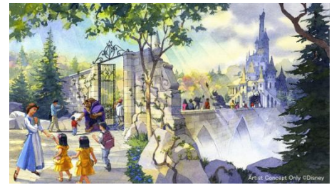
「美女と野獣の城」の外観

魔法のバラの花びらがすべて散る前に、ふたりは真実の愛を見つけ、魔法の魔法を解くことができるのでしょうか。「美女と野獣“魔法のものがたり”」で、ロマンティックなものがたりをお楽しみください。