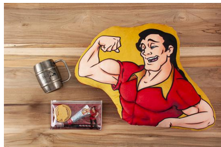
(左上)ステンレスマグ 2,600円 (左下)歯みがきセット 1,700円 (右)クッション 2,300円