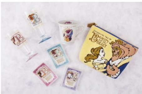
(左上の2点)グラスセット 2,600円 (中上)マグ 1,500円 (中下の3点)プレートセット 2,900円 (右)ポーチ 3,000円

映画『美女と野獣』の世界観をさらにお楽しみいただけるグッズを約100種類販売します。「美女と野獣の城」を背景に、ベルと野獣が向き合い踊る様子が描かれたロマンティックなデザインのマグやプレートセットなどをはじめ、ハンサムで腕っぷしが自慢なガストンの特徴を活かしたメガネスタンドやクッションなどの遊び心溢れるグッズが登場します。さらに、光りながら音が出るおもちゃ「メロディライト・ローズ」などものがたりを象徴するバラの花をモチーフにしたグッズも販売。豊富なラインナップでお楽しみいただけます。