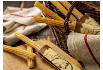
ル・フウズ・チュロス(アップルキャラメル) 1本 400円

「ラ・タベルヌ・ド・ガストン」の隣には、ガストンの子分のル・フウが経営するスナックのお店「ル・フウズ」がオープンします。東京ディズニーランド初登場のアップルキャラメル味のチュロスを販売します。