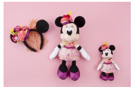
カチューシャ 1,800円、ぬいぐるみ 5,100円 ぬいぐるみバッジ 2,300円

「ミニーのスタイルスタジオ」でミニーマウスが着る、四季に合わせた4種のコスチュームがモチーフのスペシャルグッズを、季節ごとに販売します。春には、カチューシャやぬいぐるみバッジなど8種類登場します。