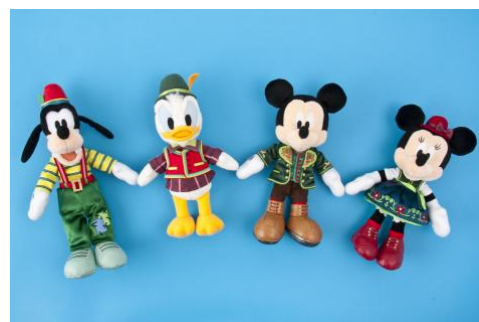
ぬいぐるみバッジ 各 2,300 円

※スペシャルグッズは、「グランドエンポーリアム」で 2020 年 4 月 8 日（水）から、「ビレッジショップス」で 2020 年 4 月 15 日（水）から販売します