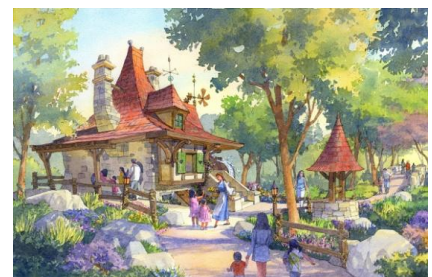
映画『美女と野獣』をテーマにしたエリア