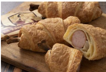
ビッグバイト・クロワッサン セット 1,140円 / 単品 750円