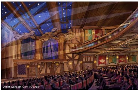
「ファンタジーランド・フォレストシアター」の内観