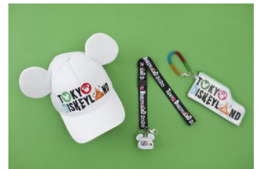
キャップ 2,900円 ネックストラップ 1,600円 パスケース 1,700円

※スペシャルグッズは、「グランドエンポーリアム」で2020年4月8日（水）から先行販売します