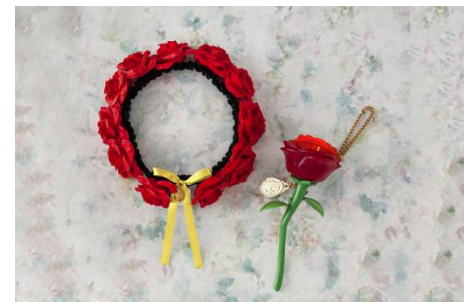
(左)ヘアバンド 2,100円 (右)メロディライト・ローズ 2,300円

※スペシャルグッズは、「グランドエンポーリアム」で2020年4月8日(水)から、「ビレッジショップ」で2020年4月15日(水)から販売します