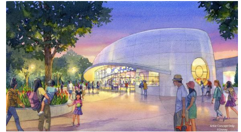
「ビッグポップ」の外観

「ビッグポップ」では3種類のフレーバーと複数のポップコーンバケットを自由に組合せてお買い求めいただけます。フレーバーは、パーク初登場の「クッキークリーム」のほか、「キャラメル&チーズ」、「ストロベリーミルク」の3種類で、いずれも香り高く濃厚な味わいが特徴の“マッシュルーム型ポップコーン”で販売します。