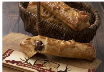
ハンターズ・パイ(ビーフシチュー) セット 1,140円 / 単品 750円