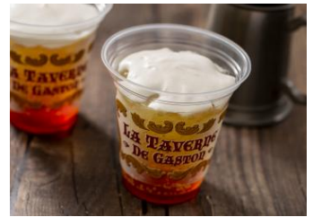
ペリーチアーズ 1杯 450円