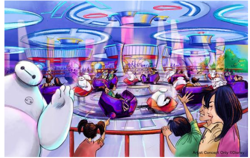
「ベイマックスのハッピーライド」

ケア・ロボットのベイマックスから「心の幸せこそ健康の秘訣」だと学んだ若き発明家のヒロ・ハマダは、予測不能な動きとノリノリの音楽が特徴的なハッピーなライドを開発しました。