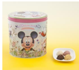
チョコレートクランチ 2,600円