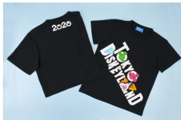
Tシャツ 100、120cm 各 1,900円 140cm 2,300円 S、M、L、LL 各 2,600円 3L 2,900円