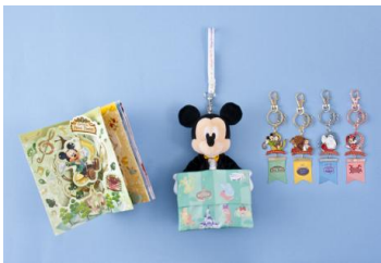
グリーティングカード 1,000円 ポケットティッシュ入れ 2,200円 キーチェーン 各 1,300円

そして、各施設の特徴をロゴマークの中に表現したスタイリッシュなデザインのグッズは、Tシャツやキャップなどの身につけグッズのほか、ネックストラップやパスケースなど、約40種類登場します。パークの中はもちろんのこと、普段の生活の中でもスマートにお使いいただけます。