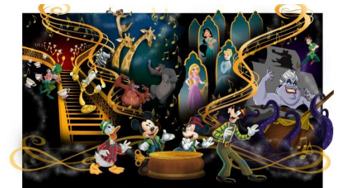
「ミッキーのマジカルミュージックワールド」

ある日、ミッキーマウスとミニーマウス、ドナルドダック、グーフィーが森の奥で大きな魔法のオルゴールを見つけました。オルゴールに付いた金色の鍵を回すと次々と扉が開き、白雪姫やピノキオ、ディズニー/ピクサー映画『トイ・ストーリー』シリーズに登場するウッディたちが、それぞれの映画の音楽とともに現れてきます。ミッキーマウスたちはその不思議な展開に喜び、どんな音楽に出会えるのかと楽しみにしていましたが、次の扉が開いても誰も出て来ず、音楽も