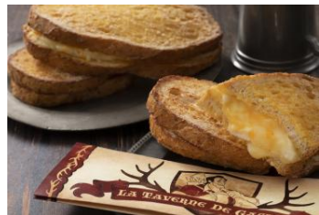
フレンチトースト・サンド セット 1,140円 / 単品 750円