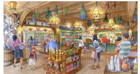
「ビレッジショップ」の内観

“ボンジュールギフト”は、村一番の技術を持つ仕立て屋が経営する帽子屋というテーマで、洋服や帽子をはじめ、さまざまな服飾や作業道具が飾られています。