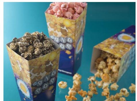
3種類のポップコーン