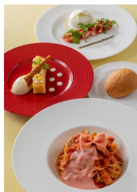
スペシャルセット 2,800円