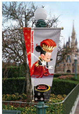
パレードルート上のバナー