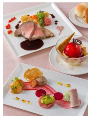
ブルーバイユーコース 5,200円