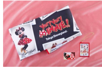
オリジナルグッズ

東京ディズニーランドホテルとディズニーアンバサダー®ホテルでは、「ベリー・ベリー・ミニー！」と連動したグッズやメニューをご用意します。東京ディズニーランドホテルでは、宿泊ゲストを対象に「ベリー・ベリー・ミニー！」デザインのホテルオリジナルグッズを販売します。オリジナルグッズはブランケットとカードケース、写真を撮るときに使えるフォトプロップスカードの3つのアイテムがセットになっています。