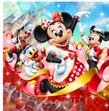
東京ディズニーランド 「ベリー・ベリー・ミニー！」

※本リリースは、2019年10月3日に発信したものに、2019年12月18日付で一部改訂を加えたものです