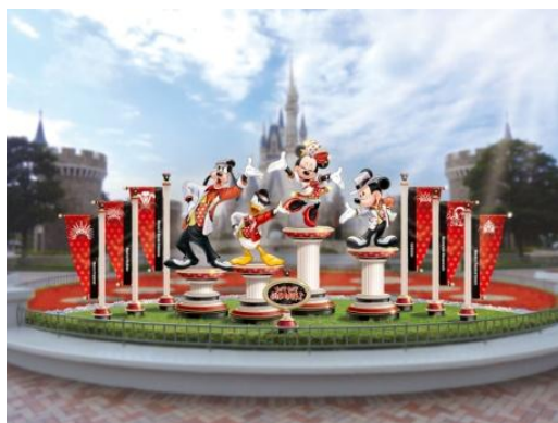
シンデレラ城前のプラザのフォトロケーション

シンデレラ城前のプラザでは、「イツ・ベリー・ミニー！」の新しいコスチュームを身にまとったミニーマウスを中心に、ミッキーマウス、ドナルドダック、グーフィーのフォトロケーションを設置します。また、パレードルート上のバナーは、「イツ・ベリー・ミニー！」や「ベリー・ミニー・リミックス」に登場する、これまでのショーやパレードをイメージしたデザインとなり、プログラム期間中に2回入れ替わります。