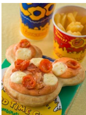
スペシャルセット 990円

また、「イーストサイド・カフェ」ではピンク色のソースやリボンのあしらいがかわいらしいパスタが印象的なスペシャルセット、「ブルーバイユー・レストラン」では一皿ごとにミニーマウスの要素をちりばめたスペシャルコースなど、おしゃれで華やかなお料理をゆったりと召しあがれます。