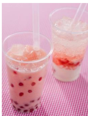
スパークリングタピオカドリンク (ストロベリーヨーグルト) 1杯 450円