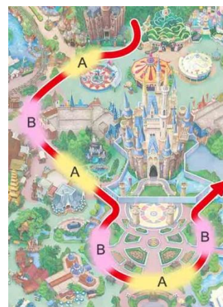
パレードルート上の停止位置 (イメージ)

※パレードは、ファンタジーランドをスタートし、ファンタジーランド/ウエスタンランドで3か所、プラザで3か所停止します