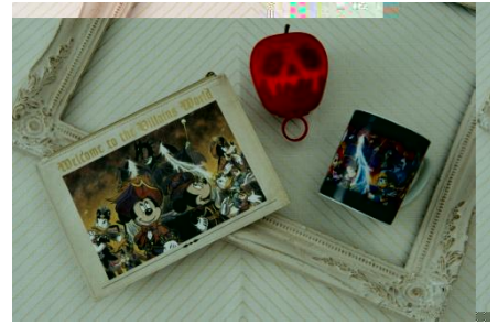
1,200 1,600 1,500

カ カ ば カ ぶ でどご ガ そ で たち カ カ だ ど びたでコ れ カ び ちんギカ ガ ご ん ガ たで ん ご たち ぶ を たち