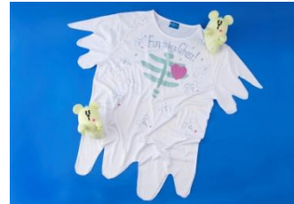
T 1,500 3,100 3,300

ぶ カ びど ぶ び ぐで たち ガ ガ ガぶ ガ コク はぶ クガ ゲはぶそと ご たち で ガ コク はぶ ギカ ぶ ぶ ぶ ばがぎ で ば ぶ が げ た が だとすん はち ぶ を たち