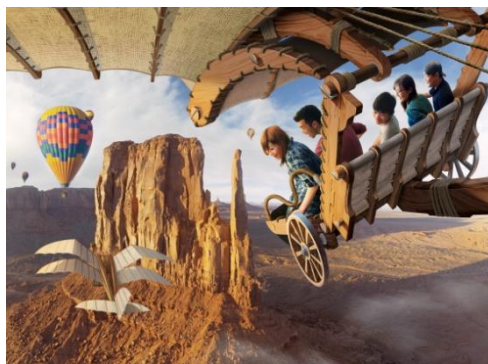
「ソアリン：ファンタスティック・フライト」の体験シーン

東京ディズニーシーのメディテレーニアンハーバーに導入予定の新規大型アトラクション「ソアリン：ファンタスティック・フライト」のオープン日が、2019年7月23日（火）に決定いたしましたのでお知らせいたします。