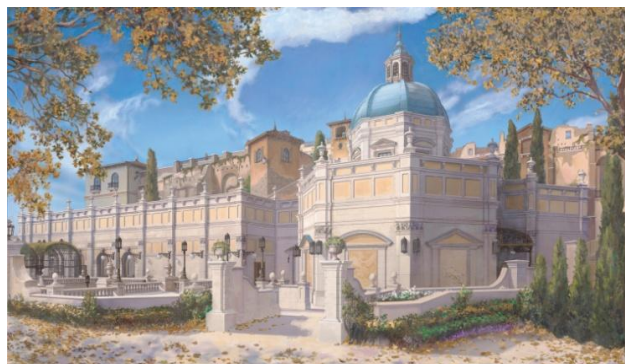
「ソアリン：ファンタスティック・フライト」の外観

「ソアリン：ファンタスティック・フライト」は、海外のディズニーテーマパークで高い人気を誇る大型アトラクション「ソアリン」に、新たなシーンが加わった、東京ディズニーシーオリジナルのアトラクションです。