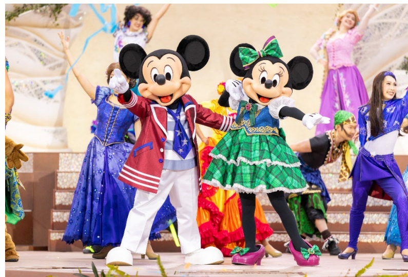
東京ディズニーシー®新規ショー「ダンス・ザ・グローブ！」