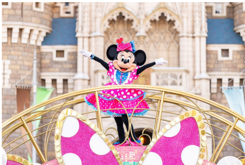
東京ディズニーランド®「ディズニー・パルパルーザ」第5弾「ミニーのファンダーランド」

第3四半期累計の営業利益は業績予想と比較して上回ったものの、 費用の時期ずれや天候リスクなどを踏まえ、現時点では業績予想を据え置くこととする