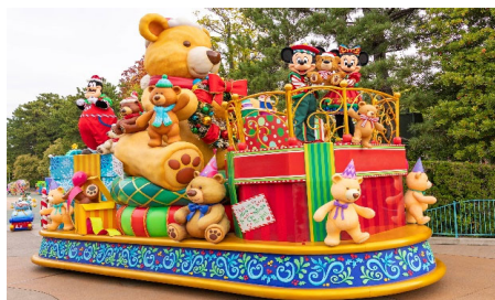
ディズニー・クリスマス「トイズ・ワンダラス・クリスマス！」