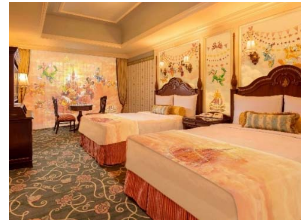
東京ディズニーリゾート40周年“ドリームゴーラウンド”スペシャルルーム (東京ディズニーランド®ホテル) ©Disney