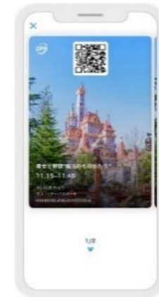
ディズニー・プレミアアクセスのご利用画面 (イメージ)