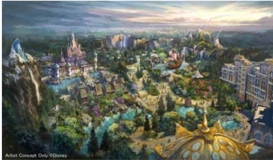
Artist Concept Only ©Disney