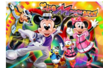
クラブマウスビート