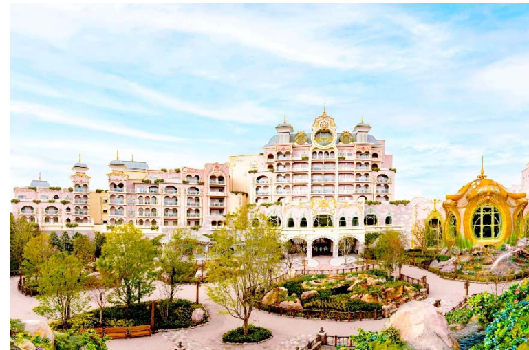
東京ディズニーシー・ファンタジースプリングスホテル