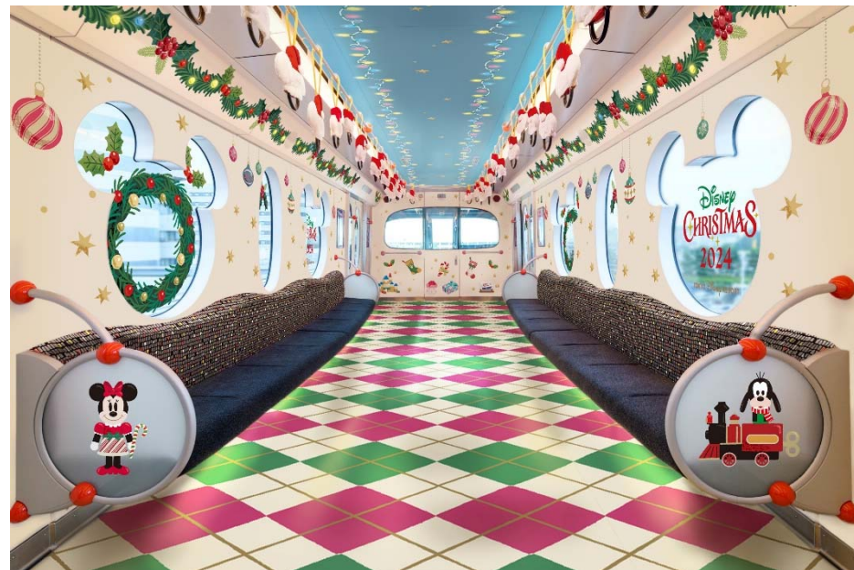
5年ぶりにクリスマス期間だけのラッピングが施された「ディズニー・クリスマス・ライナー」 (11月15日～12月25日)