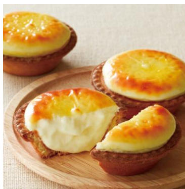
BAKE CHEESE TART

※詳細は決定次第、店舗オフィシャルウェブサイト ( http://gyg.jp ) にてお知らせします