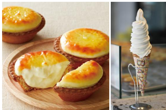
焼きたてチーズタルト (1個)税込 216円