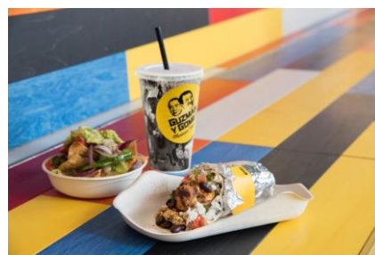
イクスピアリ店限定 「ブリチョスセット」税込 1,200円