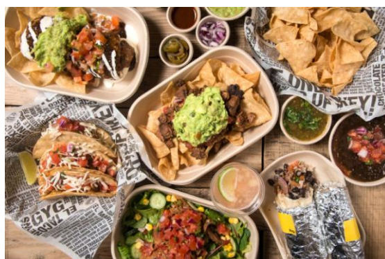
Guzman y Gomez