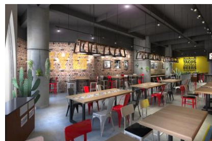
イクスピアリ店内観イメージ