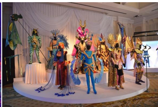
※写真は展示イメージです