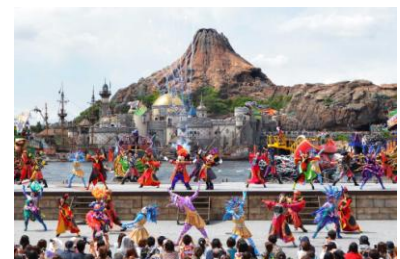
東京ディズニーシー 「ディズニー・ハロウィーン」

メディテレーニアンハーバーでは、ヴィランズ流のハロウィーンが楽しめるハーバーショー「ザ・ヴィランズ・ワールド～ウィッシュ・アンド・ディザイア～」を公演します。ヴィランズが主役となり、ヴィランズならではの魅力をディズニーの仲間たちやゲストにアピールしようと、それぞれ得意なパフォーマンスを披露します。ミッキーマウスやディズニーの仲間たちは、ヴィランズをイメージしたコスチュームを身にまとってハロウィーン・パーティーに参加し、ゲストと一緒に盛り上がります。