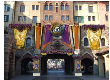
東京ディズニーシーのデコレーション

メディテレーニアンハーバーやアメリカンウォーターフロントのニューヨークエリアでは、様々なヴィランズをモチーフとしたデコレーションやフォトロケーションがミステリアスな雰囲気でお客をお出迎えます。アラビアンコーストでは、ジャファーをモチーフとしたデコレーションが施され、ヴィランズ一色になったハロウィーンをいたるところでお楽しみいただけます。