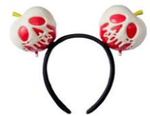
カチューシャ 1,800円 (東京ディズニーシー)