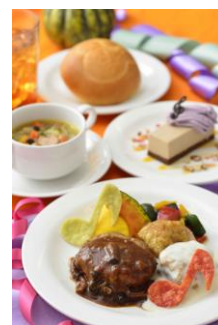
スペシャルセット 1,940円 プラザパビリオン・レストラン