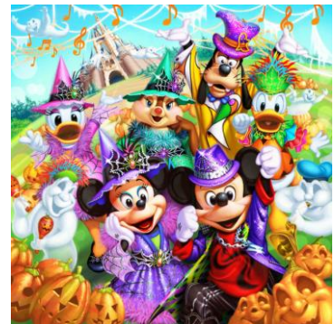
東京ディズニーランド 「ディズニー・ハロウィーン」

パレードルートでは、ミッキーマウスをはじめとするディズニーの仲間たちとハロウィーンのエンターテイメントのスターたちが、様々なジャンルの音楽パフォーマンスを繰り広げるパレード「ハロウィーン・ポップンライブ」を公演します。ミッキーマウスたちはそれぞれの音楽スタイルに合わせたハロウィーンらしいコスチュームを身にまとって登場します。パンプキンやスケルトンなどをモチーフとした個性豊かなフロートからは、思わず体が動き出す軽快な音楽が鳴り響き、ゲストもディズニーの仲間たちと一緒に最高潮に盛り上がります。このほか、ワールドバザールやプラザには“ハロウィーン・ミュージックフェスティバル”にちなんだデコレーションが登場し、パークは賑やかな雰囲気に包まれます。