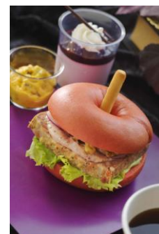
ウィックド・クイーンをイメージした スペシャルセット 1,150円 ニューヨーク・デリ