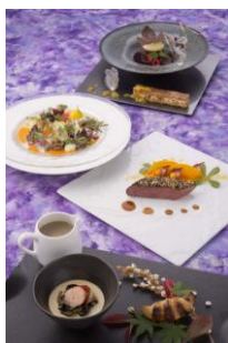
ディズニーアンバサダーホテル 「エンパイア・グリル」 エンパイアディナー