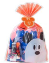
ラッピングバッグ 500円 (東京ディズニーランド) (東京ディズニーシー)