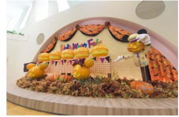
リゾートゲートウェイ・ステーションの デコレーション ※写真はイメージです

また、ディズニーリゾートラインの各駅では、ハロウィーンのデコレーションが登場し、ゲストのみなさまをお迎えします。