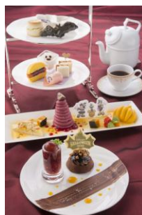
東京ディズニーランドホテル 「ドリーマーズ・ラウンジ」 アフタヌーンティーセット