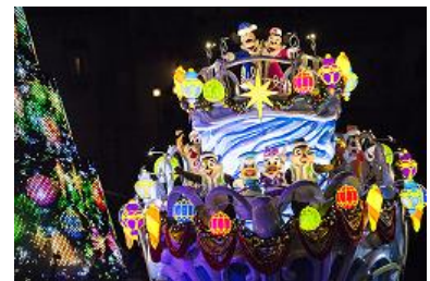
東京ディズニーシー 「カラー・オブ・クリスマス～ナイトタイム・ウィッシュ～」

「東京ディズニーシー15周年“ザ・イヤード・オブ・ウィッシュ”」を開催中の 東京ディズニーシー では、15周年のテーマである“Wish”(願い)の象徴となる色鮮やかな「ウィッシュ・クリスタル」の煌めきに加わった光り輝くクリスマスをお楽しみいただける、今年ならではのスペシャルイベント「 クリスマス・ウィッシュ 」を開催します。