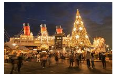
東京ディズニーシーのイルミネーション

夜、メディテレーニアンハーバーの水上で公演される「 カラー・オブ・クリスマス～ナイトタイム・ウィッシュ～ 」では、「ウィッシュ・クリスタル」の色に合わせた新しいコスチュームを着たディズニーの仲間たちとゲストの“Wish”が、クリスマスツリーを幻想的に輝かせます。クリスマスバージョンにアレンジされた東京ディズニーシー15周年のテーマソングが流れると、「ウィッシュ・クリスタル」の色に鮮やかに光り輝くツリーやオブジェが登場し、ロマンティックな雰囲気に包まれます。