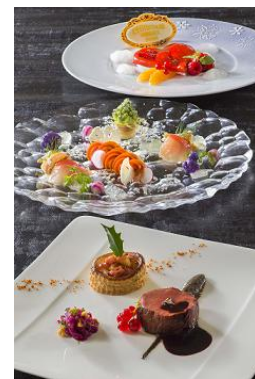
東京ディズニーシー・ホテルミラコスタ 「オチェアノ」 ディナーコース