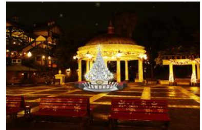
ウォーターフロントパークの 「スノークリスタル・イルミネーション」

ロストリバーデルタでは、中南米をイメージした赤や緑の原色の飾りが幻想的なイルミネーション「フィエスタ・デ・ラ・ルース」（スペイン語で「光の祭り」の意）を実施します。