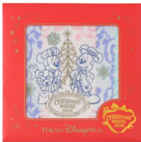
ミニタオル 1,000円 (東京ディズニーシー)