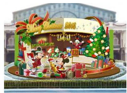
エントランスのデコレーション

そのほかにも、各テーマランドには、クリスマスらしい装飾やフォトロケーションが登場し、東京ディズニーランドのファンタジックで楽しいクリスマスを彩ります。