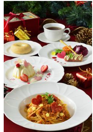
「イーストサイド・カフェ」 スペシャルコース 2,800 円