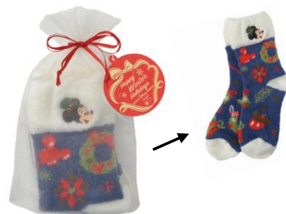
ルームソックス 1,900円 (両パーク共通)