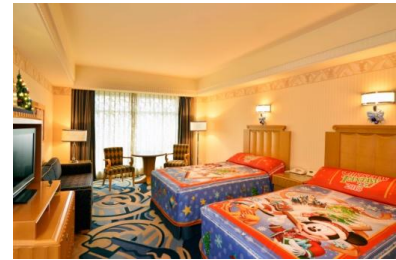
ディズニーアンバサダーホテル 「クリスマス・ファンタジー」デコレーション の客室

さらに今年はホテルエントランスのイルミネーションが一新されます。映画のフィルムをモチーフにしたクリスマスツリーにはミッキーマウスがデザインされており、驚きや楽しさあふれるディズニーアンバサダーホテルならではのクリスマスをお過ごしいただけることでしょう。