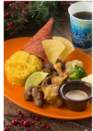
「ミゲルズ・エルドラド・キャンティーナ」 スペシャルセット 1,580 円