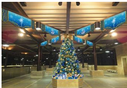
東京ディズニーシー・ステーション

また、東京ディズニーランドのスペシャルイベント「クリスマス・ファンタジー」と東京ディズニーシーのスペシャルイベント「クリスマス・ウィッシュ」をイメージしたデザインのフリーきっぷ2種類を各ステーションで販売します。