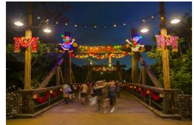
ロストリバーデルタの 「フィエスタ・デ・ラ・ルース」