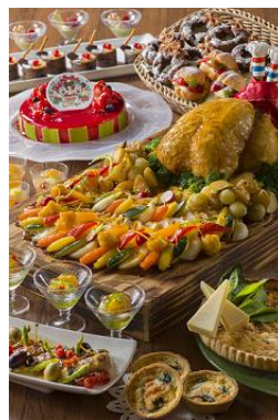
東京ディズニーランドホテル 「シャーウッドガーデン・レストラン」 ブッフェ