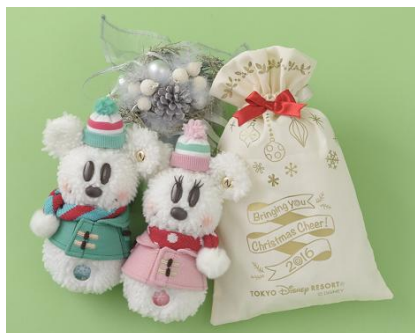
メイク・イット・マイン (袋付き) 各3,400円 ※着せ替えパーツ(帽子、マフラー、洋服)含む (両パーク共通)