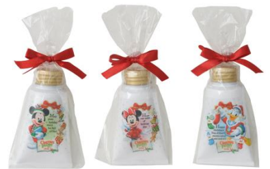
ハンドクリームセット 2,100円 (東京ディズニーランド)