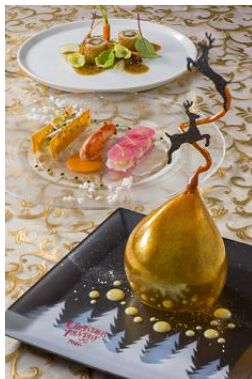
ディズニーアンバサダーホテル 「エンパイア・グリル」 エンパイアディナー

さらに12月20日（火）から12月25日（日）の期間、一部のレストランでは特別なメニューをご用意し、大切な人と過ごす心に残るひとときをお届けします。