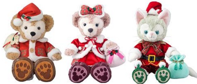
コスチュームセット 各4,800円 ※ぬいぐるみ(S)は別売りです (東京ディズニーシー)