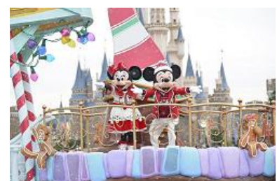
東京ディズニーランド 「ディズニー・クリスマス・ストーリーズ」

東京ディズニーランド では“ストーリーブックからあふれ出すディズニーの仲間たちのクリスマス”をテーマに、ディズニーならではのファンタジックで楽しいクリスマスをお届けするスペシャルイベント「 クリスマス・ファンタジー 」を開催します。