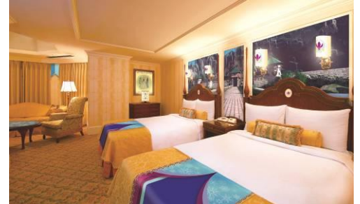
“アナとエルサのフローズンファンタジー” スペシャルルーム

東京ディズニーランドホテルでは、客室に特別なデコレーションが施された「 “アナとエルサのフローズンファンタジー” スペシャルルーム 」が登場します。客室には、ディズニー映画『アナと雪の女王』に登場する美しいアレンデル城を描いた壁画や、アナとエルサのドレスをイメージしたベッドスローなどがあしらわれ、部屋いっぱいファンタジーの世界が広がります。また、「ドリーマーズ・ラウンジ」（ロビーラウンジ）と「シャーウッドガーデン・レストラン」（ブッフェ）では、イベントに連動したスペシャルメニューをご用意します。