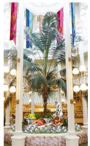
クリスタルパレス・レストランのデコレーション

※「クリスタルパレス・レストラン」でのスペシャルbuffetは、1月21日（水）から実施します