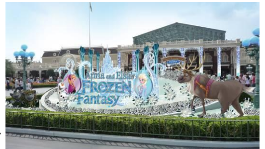
エントランスのデコレーション

エントランスには、アナとエルサたちのデコレーションが登場します。さらにプラザやワールドバザールのほか、ファンタジーランドの一部に、バナーや、映画の世界をイメージした雪と氷の結晶などをモチーフにしたデコレーションが施されます。