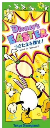
「“ディズニー・イースター”うさたまを探せ！」 のツール(表紙)

東京ディズニーランドでは、パーク内のさまざまな場所で遊んでいる“うさたま”たちを探しだす「“ディズニー・イースター”うさたまを探せ！」（無料）をパーク内で配布します。ツールのマップに書かれた“うさたま”の目撃情報をヒントに、パーク中のあらゆる場所に逃げ出した“うさたま”を探します。見事“うさたま”を探し出したゲストには、プログラム達成の証であるオリジナルシールをプレゼントします。