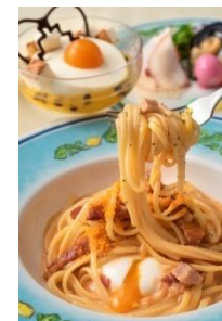
「カフェ・ポルトフィーノ」 スペシャルセット 1,880円