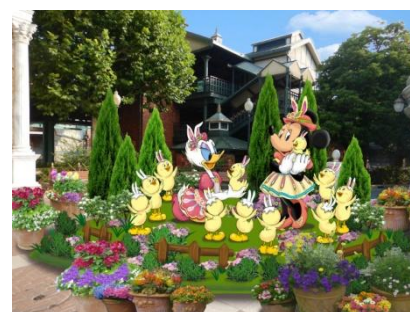
デコレーション (アメリカンウォーターフロント)