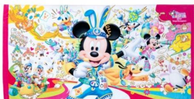
ワイドバスタオル 3,400円