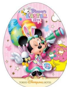
東京ディズニーランドホテル ポストカード