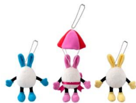
ストラップセット 1,800円

東京ディズニーランドでは、パレード「うさたま大脱走！」に登場する“うさたま”や、“うさたまチェイサー”に扮したディズニーの仲間たちが描かれたグッズのほか、“うさたまチェイサー”になりきることができるファンキャップなどのグッズが約60種類登場します。