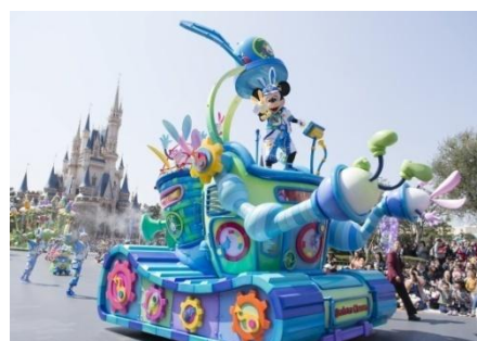
東京ディズニーランド 「ディズニー・イースター」