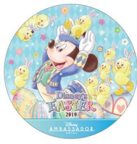
ディズニーアンバサダーホテル ポストカード