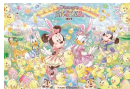
レジャーシート 650円