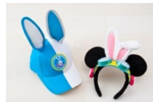
ファンキャップ 2,500円 カチューシャ 1,800円