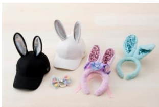
キャップ 各 2,600 円 うさみみカチューシャ 各 1,300 円 ヘアゴム 700 円～900 円

そのほか、ウサギのキャラクター、ミス・バニーやサンパーたちがデザインされた、新生活を彩るテーブルウェアやインテリアなどのグッズが約 30 種類登場します。