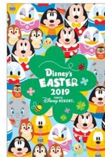
東京ディズニーセレブレーションホテル ポストカード