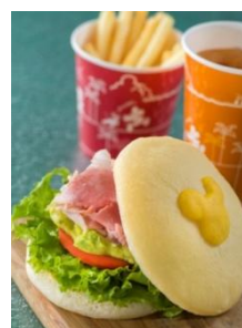
「ニューヨーク・デリ」 スペシャルセット 1,230円

「ニューヨーク・デリ」では、目玉焼きのように見えるバンズにハムやアボカドを挟み込んだサンドウィッチのスペシャルセットが登場するほか、「カフェ・ポルトフィーノ」では、タマゴを使った人気料理のカルボナーラに、タマゴをあしらった