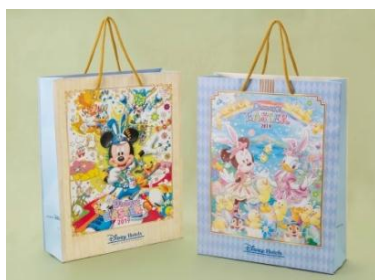
ディズニーアンバサダーホテル 東京ディズニーランドホテル ペーパーバッグ(共通)

※レストラン、ラウンジの「ディズニー・イースター」のメニューは3月26日（火）から先行販売します