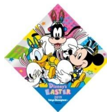
「“ディズニー・イースター”うさたまを探せ！」 のオリジナルシール