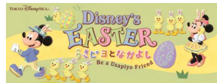
「“ディズニー・イースター”うさピヨとなかよし」 のツール(表紙)

東京ディズニーシーでは、「“ディズニー・イースター” うさピヨとなかよし」（無料）をパーク内で配布します。このツールを通じて、ゲストの皆さまは“うさピヨ”ともっと仲良くなることができます。一緒にいるとハッピーになれる“うさピヨ”たちと「ディズニー・イースター」を楽しんでみませんか。