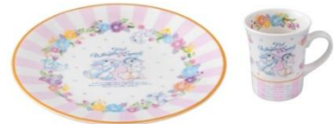
プレート 1,300 円 マグ 1,300 円