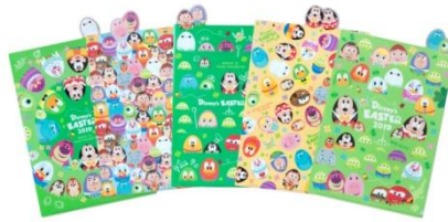
クリアホルダーセット 1,100 円