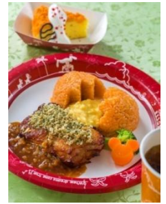
「グランマ・サラのキッチン」 スペシャルセット 1,580円