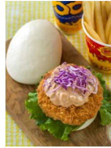
「ヒューイ・デューイ・ルーイのグッドタイム・カフェ」 スペシャルセット 990円

「ヒューイ・デューイ・ルーイのグッドタイム・カフェ」では、タマゴ型のパオにスクランブルエッグやハムカツをサンドしたスペシャルメニューが登場するほか、「グランマ・サラのキッチン」では、割れたタマゴをイメージしたケチャップライスとスクランブルエッグ、デザートにタマゴ型のチョコレートを使用したスペシャルセットをご用意します。そのほか、“うさたま”をデザインしたスーベニアカップ付きデザートなども販売します。