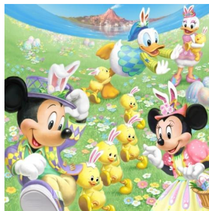
東京ディズニーシー 「ディズニー・イースター」

パレードルートでは、“うさたまチェイサー”に扮したディズニーの仲間たちが、パーク中に逃げ出した“うさたま”を追いかけるヘンテコ楽しいパレード「うさたま大脱走！」を公演します。