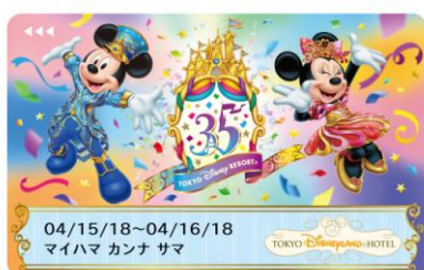
東京ディズニーランドホテル 35周年限定デザインのルームキー (4月10日～7月7日のデザイン)

そのほかにも、ホテル毎に宿泊やレストラン、宴会やウェディングなどで、特別プログラムや限定アイテムをご用意し、ゲストの皆さまに“Happiest” なひとときをお届けします。