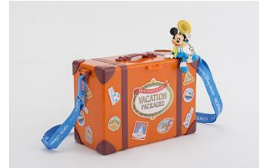
オリジナルポップコーンバケット

また、東京ディズニーリゾート 35 周年を記念して、2018 年 4 月 15 日（日）～2019 年 3 月 25 日（月）までにチェックインするすべてのプランに、限定デザインのオリジナルポップコーンバケットが 1 部屋につき 1 つ付くほか、オリジナルグッズも特別なデザインでご用意いたします。