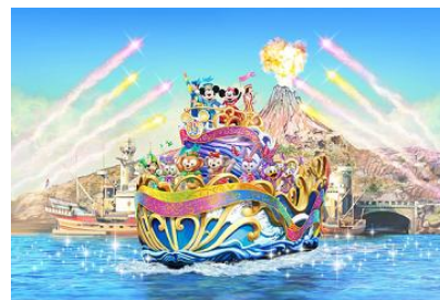
「ハピエストセレブレーション・オン・ザ・シー」

東京ディズニーシーでは、35 周年限定の水上グリーティング「ハピエストセレブレーション・オン・ザ・シー」を、メディテレーニアンハーバーで実施します。祝祭感あふれる華やかなコスチュームに身を包んだミッキーマウスたちとダッフィー&フレンズは、リボンなどの装飾が施された船に乗って登場します。ショーの中では 35 周年のテーマソングが流れ、ゲストとディズニーの仲間たちが一体となって、東京ディズニーリゾートの 35 周年をお祝いします。