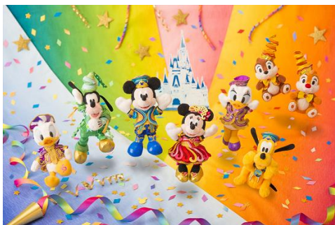
ぬいぐるみバッジ各種

リボンや紙吹雪をモチーフにした祝祭感あふれるデザインが施されたグッズを中心に、ぬいぐるみバッジや蝶ネクタイ、ファンキャップなど、35周年をより楽しくお祝いできるグッズを展開します。