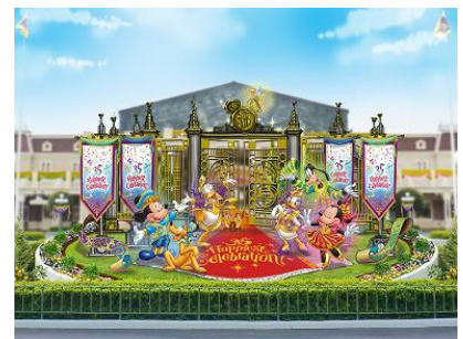
エントランスの花壇

エントランスの花壇には、ディズニーの仲間たちが園内へと続く赤い絨毯の前に立ち、ゲストを迎え入れるような祝祭感あふれるフォトロケーションが登場するほか、シンデレラ城前の中央花壇には、東京ディズニーリゾート35周年のロゴをあしらった大きなオブジェが設置されます。