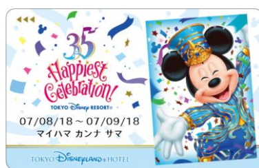
東京ディズニーランドホテル 35周年限定デザインのルームキー (7月8日～1月10日のデザイン)