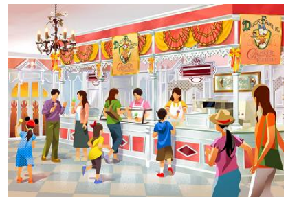
「アイスクリームコーン」の店内