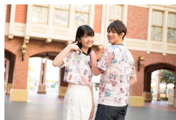
Tシャツ着用イメージ

また、これまでの35年間の楽しい思い出がたくさんつまったスクラップブックをイメージしたデザインのグッズを販売するほか、35年間一緒に時を刻んできた思い出を形にするオリジナル制作グッズや数量限定の特別なグッズを販売します。