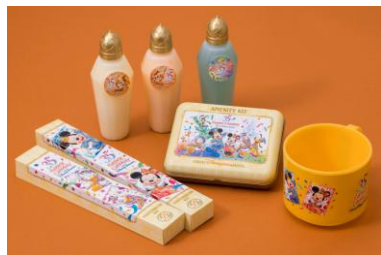
東京ディズニーランドホテル 35周年限定デザインの ルームアメニティー