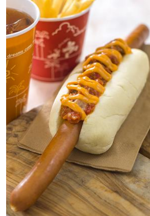
スペシャルセット 990 円