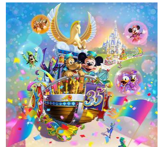
「ドリーミング・アップ！」

「東京ディズニーリゾート35周年“Happiest Celebration!”」のオープニングを飾るのは、祝祭感あふれる華かな昼のパレード「ドリーミング・アップ！」。ミッキーマウスやディズニーの仲間たちは、ディズニーのイマジネーションにあふれた夢の世界へゲストの皆さまをご案内します。