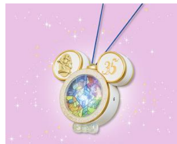
ハピエストメモリーメーカー (本体)2,300 円

また、インタラクティブな機能を持ち、35周年だけの特別な体験をゲストに感じていただける「ハピエストメモリーメーカー」を販売します。「ハピエストメモリーメーカー」を持って、東京ディズニーランド、東京ディズニーシーの各所に設置されるミッキーマウスの像「ハピエストミッキースポット」の近くに行くと、ミッキーマウスの楽しそうな声が聞こえてくるほか、パーク内の各所でもディズニーの仲間たちからの楽しいサプライズをお楽しみいただくことができます。