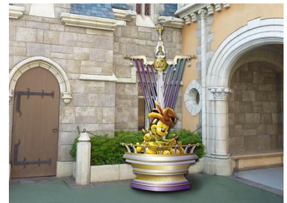
「ハピエストミッキースポット」

東京ディズニーランドの各テーマランドや東京ディズニーシーの各テーマポートには、そのエリアならではのさまざまなコスチュームを着てポーズをとっているミッキーマウスの像「ハピエストミッキースポット」が、1年間で合計35体登場します。すべての「ハピエストミッキースポット」を巡ったり、お気に入りのミッキーマウスを見つけたりと、パーク全体でお楽しみいただけます。