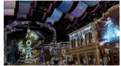
セレブレーションストリート

中央には、高さ約10メートルのモニュメント「セレブレーションタワー」が登場。モニュメントには9つのミッキーマウスの像が置かれ、これまで東京ディズニーランドで開催してきた周年の特別なコスチュームや、東京ディズニーシーのグランドオープン時のコスチュームなど、皆さまの記憶に残っている懐かしいコスチュームを身にまとっています。