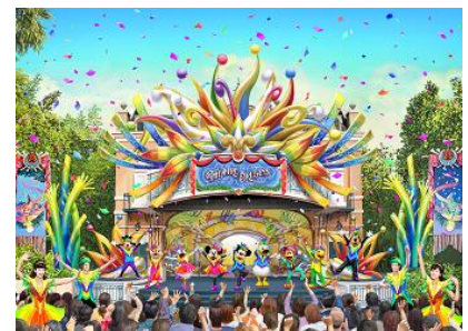
「レッツ・パーティグラ！」

世界中を旅したドナルドダックとホセ・キャリオカがニューオーリンズにたどり着き、ミッキーマウスやパンチートたちも一緒になって最高に楽しいお祭り“パーティグラ（パーティーとニューオーリンズの伝統的なカーニバル“マルディグラ”を掛け合わせた造語）”を開きます。