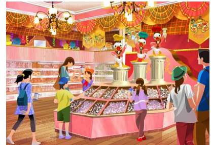
「ペイストリーパレス」の店内

※「ペイストリーパレス」は株式会社ユーハイムが、「アイスクリームコーン」は株式会社 明治が提供しています