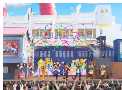
「ハロー、ニューヨーク！」

ミッキーマウスやディズニーの仲間たちが、ニューヨークで行きたいところや、やりたいことを思い思いに話し始めると、ダウントウンでのクールなストリートパフォーマンスや、セントラルパークでのデート、ブロードウェイの華やかなダンスといった、ニューヨークの街の魅力や楽しみ方が紹介され、ゲストとともに心躍る楽しい時間を過ごします。最後はゲストと一緒に盛り上がる最高に華やかなフィナーレを迎えます。