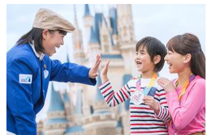
「ハピエストサプライズ」

よりたくさんの笑顔がパークのあちらこちらにあふれるように、イベント期間中毎日、キャストからゲストの皆さまにサプライズでお渡します。