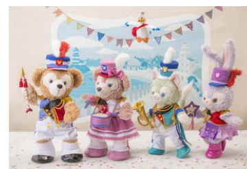
コスチュームセット 各 4,800 円 ※ぬいぐるみ(S)は別売り