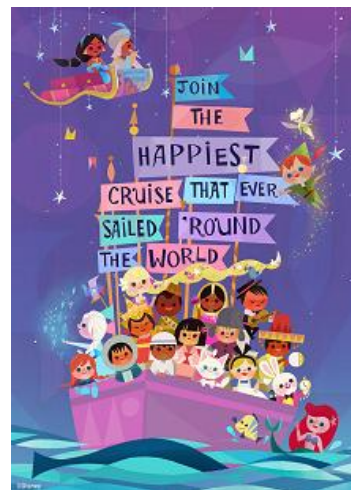
「イッツ・ア・スモールワールド」に追加されるディズニーキャラクター

そのほか、リニューアルする「イッツ・ア・スモールワールド」の世界観を体験できるメニューやグッズも販売します。