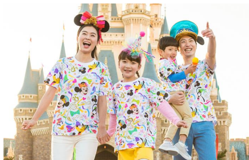
身につけグッズ着用イメージ

また、インタラクティブな機能を持ち、35周年だけの特別な体験をゲストに感じていただける「ハピエストメモリーメーカー」を販売します。「ハピエストメモリーメーカー」を持って、東京ディズニーランド、東京ディズニーシーの各所に設置されるミッキーマウスの像「ハピエストミッキースポット」の近くに行くと、ミッキーマウスの楽しそうな声が聞こえてくるほか、パーク内の各所でもディズニーの仲間たちからの楽しいサプライズをお楽しみいただくことができます。