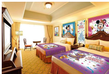
東京ディズニーランドホテル 35周年のデコレーションを施した客室