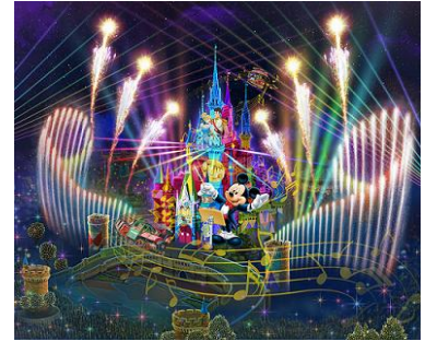
「Celebrate! Tokyo Disneyland」

ナイトタイムスペクタキュラー「Celebrate! Tokyo Disneyland」は、これまでにない壮大なスケールでお贈りする新しい夜のエンターテイメントです。シンデレラ城に映し出される映像に、色鮮やかな噴水や夜空いっぱいに広がる光の演出などを組み合わせ、新たな演出でお届けします。魔法にかかったシンデレラ城を舞台に、ミッキーマウスがお届けする夢と魔法の王国をめぐる楽しい音楽の旅をお楽しみください。