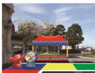
『カーズ』シリーズがテーマ のゲームブース