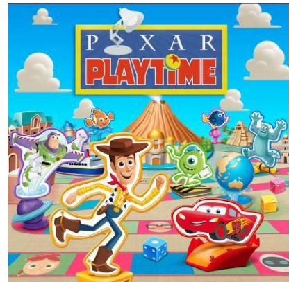
東京ディズニーシー「ピクサー・プレイタイム」

東京ディズニーシー®では、ディズニー/ピクサー映画の世界を感じていただくことができるスペシャルイベント「ピクサー・プレイタイム」が初開催。おなじみのディズニー/ピクサー映画のキャラクターたちが、パークのあちこちで繰り広げるさまざまなエンターテイメント・プログラムや、これまでにない体験型のデコレーションとしてゲームブースが登場。お子さまから大人の方まで楽しむことができる数々の魅力的なプログラムがご体験いただけます。