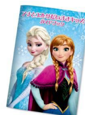
アナとエルサ だいすきキッズ ガイドブック

今年新たに、小学生以下のお子さまを対象に、アナやエルサになりきってパークをお楽しみいただける様々なポイントをご案内する「アナとエルサだいすきキッズガイドブック」を東京ディズニーランドやディズニーホテルなどで配布します。