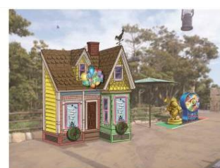
『カールじいさんの空飛ぶ家』 がテーマのゲームブース