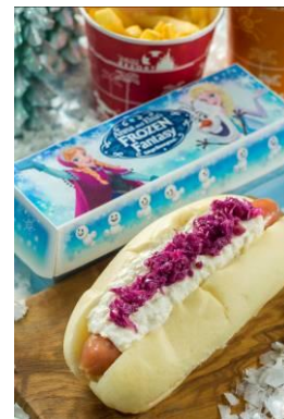
リフレッシュメントコーナー スペシャルセット 900 円

※スペシャルグッズ、スペシャルメニューの内容は、変更または売り切れとなる場合があります