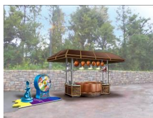
『レミーのおいしいレストラン』 がテーマのゲームブース