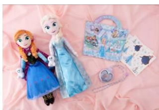
ぬいぐるみ 各 3,500 円 ノート&シールセット 1,000 円 ライティングペンダント 1,800 円