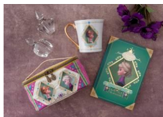
ポーチ 2,200 円 マグ 1,900 円 ノート 1,500 円