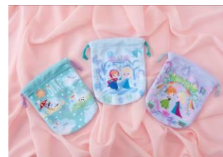
きんちゃくセット 1,600 円