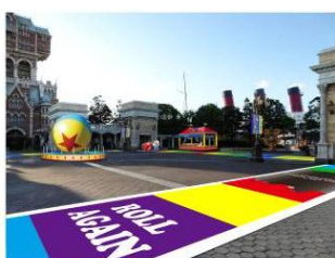
ウォーターフロントパークの 床面デコレーション

さらに、体験型のデコレーションとしてパーク内にはゲームブースが登場。ライトニング・マックイーンのタイヤ交換を手伝ったり、料理好きなレミーのメニューの仕上げを手伝ったりなど、仲間と協力してクリアするゲームが、パークのあちらこちらに設置されます。