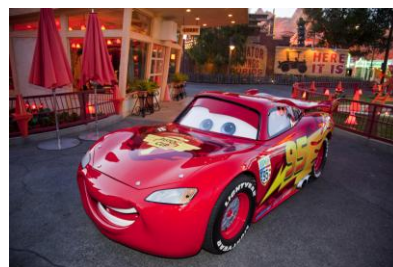
「ライトニング・マックィーン・ ヴィクトリーラップ」 ※写真はディズニー・カリフォルニア・ アドベンチャー・パークのものです

大勢のゲストが見守る中、ライトニング・マックィーンが登場。彼の合図とともに、ゲストはアメリカンウォーターフロントのドライブをスタートし、ニューヨークエリアを練り歩きます。後半になるにつれ音楽も盛り上がり、お祭りムード一色に染まります。最後はチェッカーフラッグが振られてゴールです。