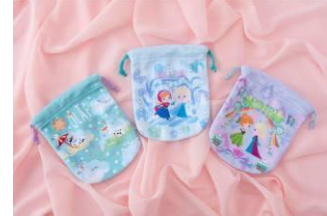
きんちゃくセット 1,600 円