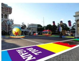
ウォーターフロントパークの 床面デコレーション

さらに、体験型のデコレーションとしてパーク内にはゲームブースが登場。ライトニング・マックイーンのタイヤ交換を手伝ったり、料理好きなレミーのメニューの仕上げを手伝ったりなど、仲間と協力してクリアするゲームが、パークのあちらこちらに設置されます。