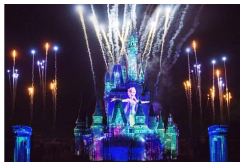
「フローズン・フォーエバー」

おなじみの数々の名場面や、誰もが一度は耳にした「レット・イット・ゴー～ありのままで～」、「生まれてはじめて」、「とびら開けて」などの名曲が響き渡り、最後は打ち上がるパイロとともに感動的なフィナーレをお楽しみいただけます。