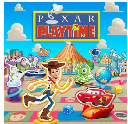
東京ディズニーシー「ピクサー・プレイタイム」

東京ディズニーシー®では、ディズニー/ピクサー映画の世界を感じていただくことができるスペシャルイベント「ピクサー・プレイタイム」が初開催。おなじみのディズニー/ピクサー映画のキャラクターたちが、パークのあちこちで繰り広げるさまざまなエンターテイメント・プログラムや、これまでにない体験型のデコレーションとしてゲームブースが登場。お子さまから大人の方まで楽しむことができる数々の魅力的なプログラムがご体験いただけます。