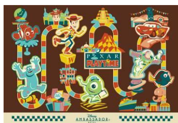
ディズニーアンバサダーホテル ポストカード（2種類）