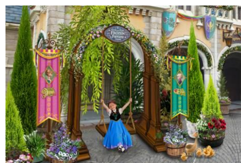
映画のシーンをイメージしたフォトロケーション