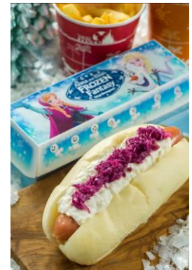
リフレッシュメントコーナー スペシャルセット 900 円

※スペシャルグッズ、スペシャルメニューの内容は、変更または売り切れとなる場合があります