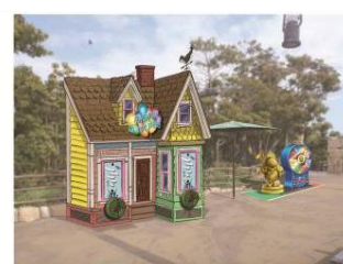
『カールじいさんの空飛ぶ家』 がテーマのゲームブース