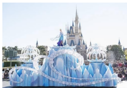
「フローズンファンタジーパレード」

映画の代表的なシーンで使われた音楽に乗せて、雪が舞う美しいパレードを、ぜひお楽しみください。