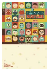
東京ディズニーシー 「ピクサー・プレイタイム」 デザインのフリーきっぷ

ディズニー/ピクサー映画に登場するキャラクターたちがラッピングされたモノレール「ピクサー・プレイタイム・ライナー」が運行するほか、リゾートゲートウェイ・ステーションには「ピクサー・プレイタイム」に連動したフォトロケーションもお目見えます。さらに、「アナとエルサのフローズンファンタジー」に合わせて、アナとエルサたちのフォトロケーションが東京ディズニーランド・ステーションに登場します。