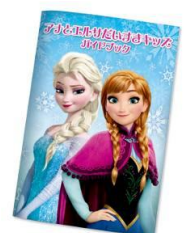
アナとエルサ だいすきキッズ ガイドブック

今年新たに、小学生以下のお子さまを対象に、アナやエルサになりきってパークをお楽しみいただける様々なポイントをご案内する「アナとエルサだいすきキッズガイドブック」を東京ディズニーランドやディズニーホテルなどで配布します。