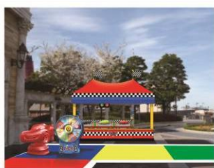
『カーズ』シリーズがテーマ のゲームブース