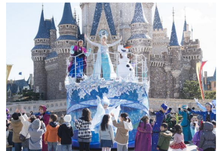
東京ディズニーランド 「アナとエルサのウィンターグリーティング」

東京ディズニーランド®では、冬のスペシャルイベント「アナとエルサのフローズンファンタジー」がファイナルを迎えます。ディズニー映画『アナと雪の女王』をテーマにしたパレード「フローズンファンタジーパレード」やグリーティングショー「アナとエルサのウィンターグリーティング」など、昨年引き続き実施するほか、今年は、映画でも印象的なエルサの氷の城のシーンを彷彿とさせるような体験型のフォトロケーションが登場し、アナやエルサになりきって写真を撮ることができます。