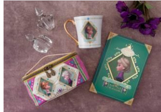
ポーチ 2,200 円 マグ 1,900 円 ノート 1,500 円