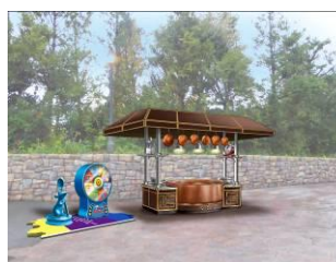
『レミーのおいしいレストラン』 がテーマのゲームブース