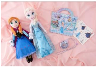
ぬいぐるみ 各 3,500 円 ノート&シールセット 1,000 円 ライティングペンダント 1,800 円