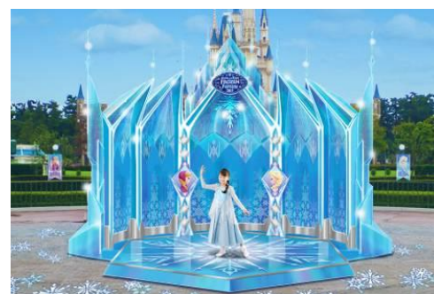
エルサの氷の城をイメージした フォトロケーション

そのほかにもパークのいたるところに短編映画に登場した小さい雪だるまのスノーギースがいたり、ファンタジーランドにアレンデル王国のお城や広場をイメージしたデコレーションが施されたりと、ここでしか味わえないディズニー映画『アナと雪の女王』の世界をお楽しみいただけます。