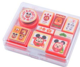
スタンプセット 820 円