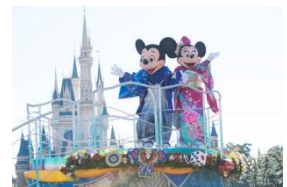
今年の「ニューイヤーズ・グリーティング」の様子

和服姿のミッキーマウスやミニーマウスをはじめ、2018年の干支にちなんだキャラクターのプルートなどディズニーの仲間たちが、お正月ならではの飾り付けが施されたフロートなどに乗って、1年の始まりをお祝いします。