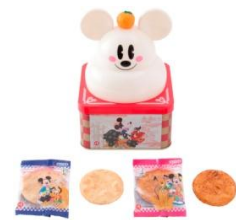
おせんべい 1,300 円