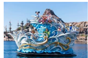
今年の「ニューイヤーズ・グリーティング」の様子

お正月らしいコスチュームに身を包んだミッキーマウスやミニーマウスをはじめ、干支にちなんだキャラクターのプルートなどディズニーの仲間たちが、2018年の装飾が施された船に乗って、ゲストの皆さまに新年のご挨拶をします。