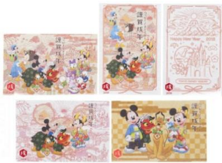
年賀状セット 550 円

お正月らしい羽織袴を着たディズニーの仲間たちのぬいぐるみバッジや、プルートをモチーフにした“だるま”がデザインされたアイテムが登場します。このほか、和服姿のミッキーマウスをはじめとしたディズニーの仲間たちがデザインされた年賀状やスタンプセット、新年の贈り物に最適なデザインのお菓子など約 50 種類のグッズを販売します。