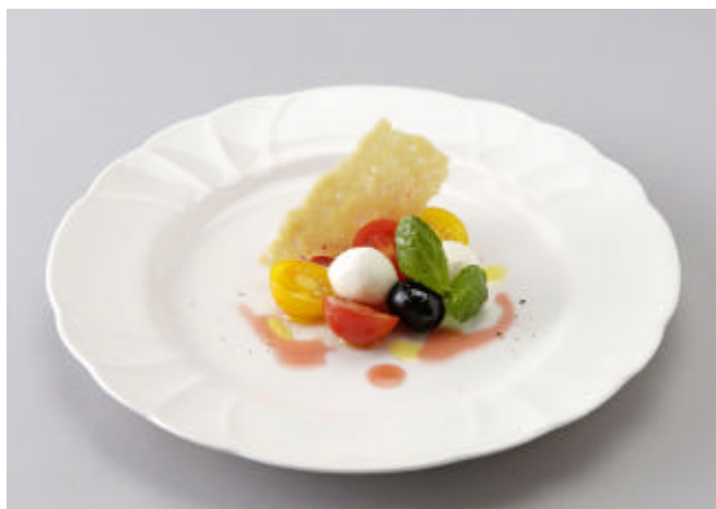
カプレーゼ（モッツァレラチーズとトマトの前菜）